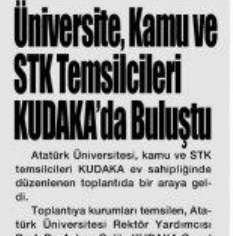
Üniversite, Kamu ve STK Temsilcileri KUDAKA'da Buluştu Atatürk Üniversitesi, kamu ve STK temsilcileri KUDAKA ev sahipliğinde düzenlenen toplantıda bir araya geldi. Toplantıya kurumları temsilen, Atatürk Üniversitesi Rektör Yardımcısı

STK Temsilcileri Atatürk Üniversitesi, kamu ve STK temsilcileri KUDAKA ev sahipliğinde düzenlenen toplantıda bir araya geldi.