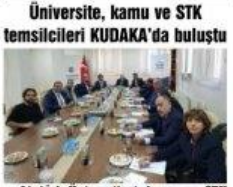
Üniversite, kamu ve STK temsilcileri KUDAKA'da buluştu Atatürk Üniversitesi, kamu ve STK temsilcileri KUDAKA ev sahipliğinde düzenlenen toplantıda bir araya geldi.

Üniversite, kamu ve STK temsilcileri KUDAKA`da buluştu .Atatürk Üniversitesi, kamu ve STK temsilcileri KUDAKA ev sahipliğinde düzenlenen toplantıda bir araya geldi.