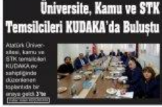
Üniversite, Kamu ve STK Temsilcileri KUDAKA'da Buluştu Atatürk Üniversitesi, kamu ve STK temsilcileri KUDAKA ev sahipliğinde düzenlenen toplantıda bir araya geldi.

Üniversite, Kamu ve STK Temsilcileri KUDAKA da. Buluştu Atatürk Üniversitesi, kamu ve STK temsilcileri KUDAKA ev sahipliğinde düzenlenen toplantıda bir araya geldi.