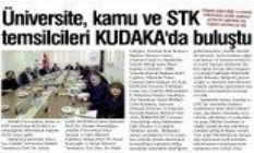
Üniversite, kamu ve STK temsilcileri KUDAKA'da buluştu Atatürk Üniversitesi, kamu ve STK temsilcileri KUDAKA ev sahipliğinde düzenlenen toplantıda bir araya geldi.

KUDAKA ev sahipliğinde düzenlenen toplantıda bir araya geldi. Bölgedeki sanayi sorunlarının ve bu sorunlara yönelik çözüm önerilerinin konuşulduğu toplantıda bölge paydaşları arasındaki işbirliğinin geliştirilmesine yönelik öneriler de tartışıldı.