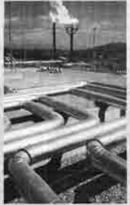
28.06.2007 - BİRGÜN GAZETESİ

Raporda, TKP'nin seçimlerde "Komunlara bedelsiz elektrik vereceğiz" vaadinde bulunduğu kaydedildi. Genç Parti'nin diğer partilerden daha açık bir şekilde 'özel sektör' vurgusunu yaptığını belirttiği raporda, "EMEP'in programında enerji alanında özel bir yer ayrılmıyor. Genel yapılarımlarda EMEP'in kamuusal bir anlayış içinde olduğu görülmüyor" denildi.