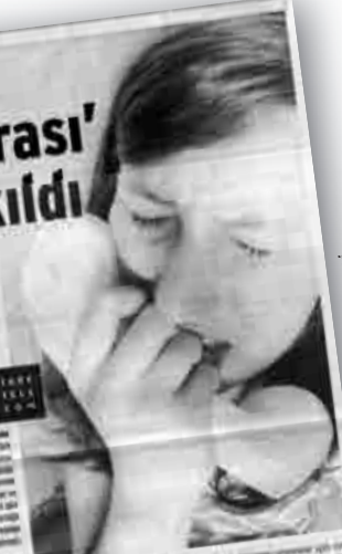
14.06.2007 - BİRCÜN GAZETESİ