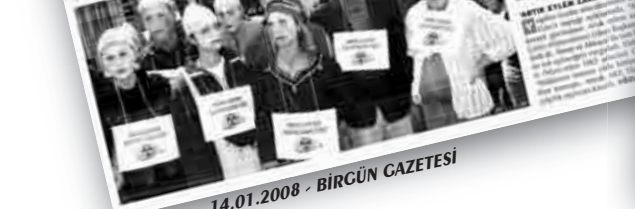
14.01.2008 - BİRCÜN GAZETESİ

Başbakan nükleer santraller için tarih verirken, Fransız nükleer enerji şirketi Areva da, bir "nükleer rönesans" yaşadığını söyledi. Elbette bizimki gibi ülkelerde...