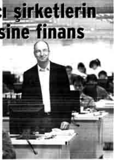
KURUMAR YAPICI İRAN

Ar-Ge faaliyetlerine yeni teşvikler getiren kanun tasarısı, Meclis komisyonu tarafından benimsendi. Üzmanlar, 50 kişilik Ar-Ge personeli zorunluluğunun KOBİ'ler tarafından yerine getirilemeyeceğini, tasarıdan önemli ölçüde büyük yabancı şirketlerin faydalanacağını belirtiyor.