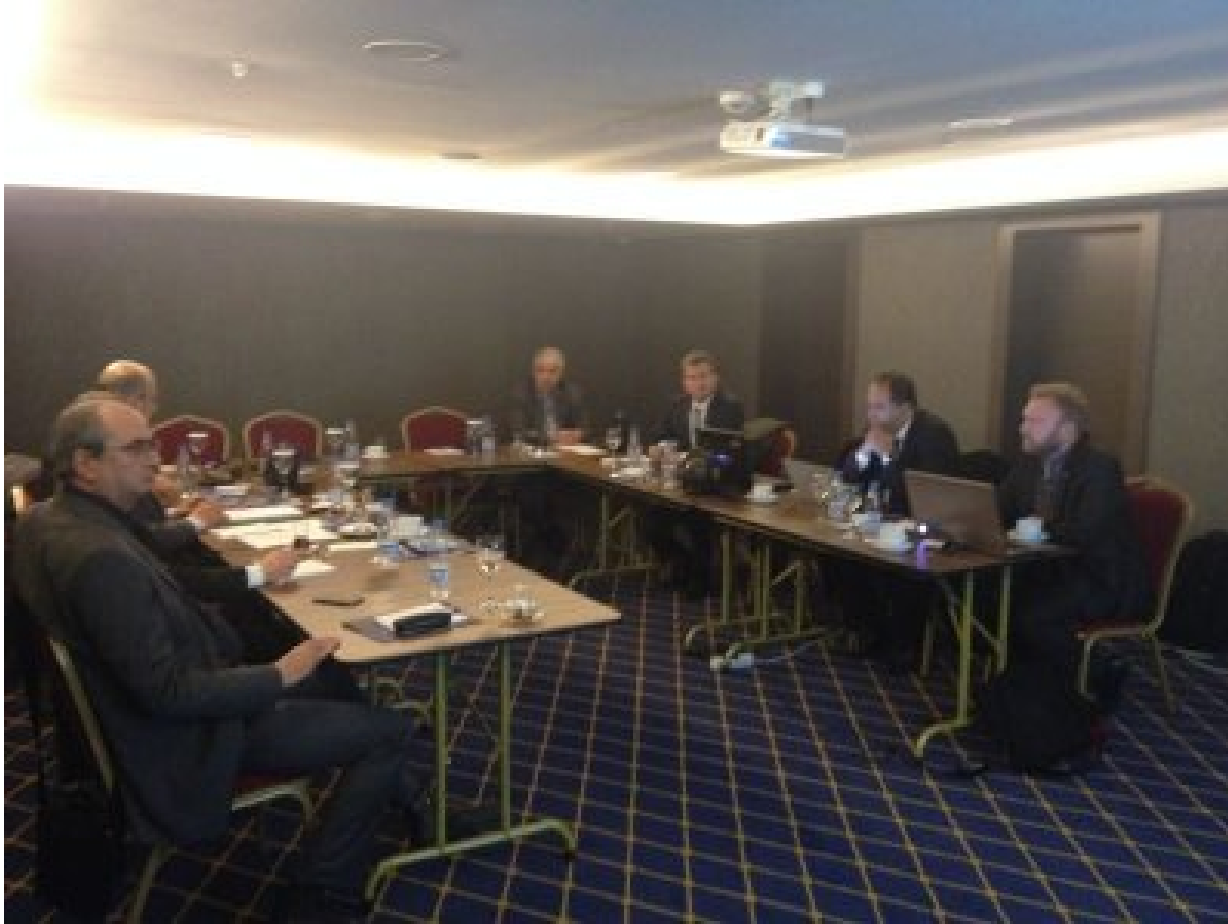
1. YÜRÜTME KURULU TOPLANTISI