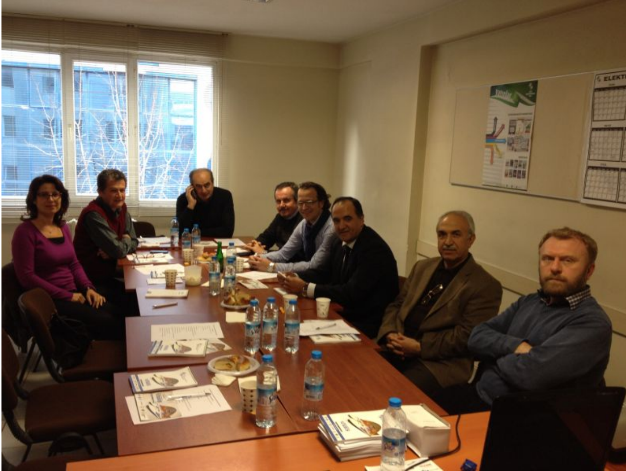
2. YÜRÜTME KURULU TOPLANTISI