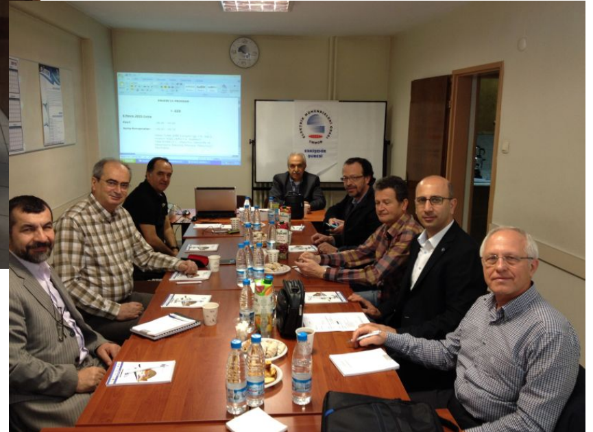
3. YÜRÜTME KURULU TOPLANTISI