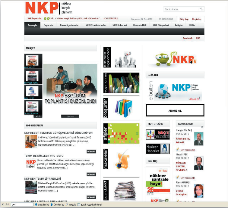
*NKP İnternet Sayfası Açıldı