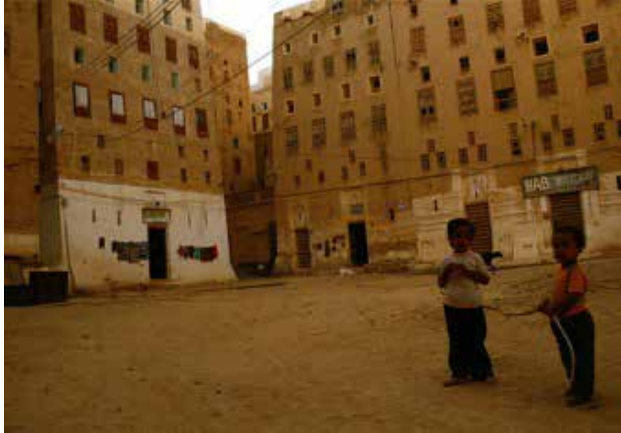
Bu apartman misali yapılar, aslında kerpiçten yapılmış, müstakil köy evleri...