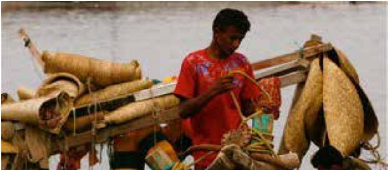
Hale demirlemiş bir balık teknesi...

Aslında maceramız bir kaç gün daha Sanaa'da devam etmesine rağmen kendini tekrarlamaması için burada yazımıza son vermenin uygun düşeceğini sanıyorum. Son söz olarak diyebilirim ki tüm zorluklarına rağmen hayatımda en fazla macera biriktirmeme sebep olan ve en heyecan verici yolculuk Yemen seyahatimiz olmuştu. Tüm zorluklarına rağmen Yemen'i gezi listenize almanız dileği ile!