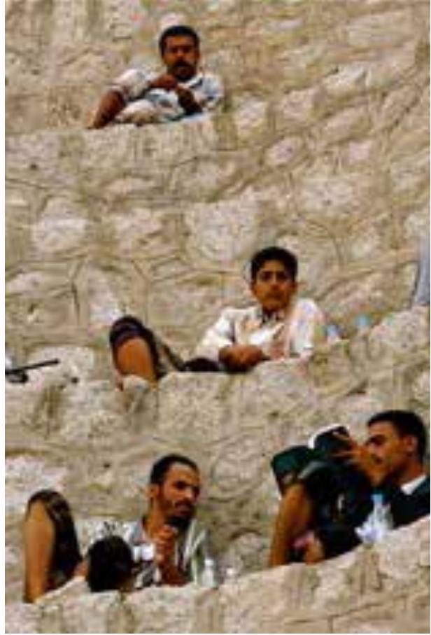
Sabır dağı üzerindeki bir kat meclisi...

Yemek faslının ardından şoförümüz bizi Taiz'e tepeden bakan ünlü Sabır dağına çıkardı. Döne döne zirveye ulaştık. Dağ üzerinde kademeli olarak oturup kat meclisi kuran insanlar, çiçekçi çocuklar ve küçük mezralar yolculuğumuzu süsleyen güzel ayrıntılardı. Gerçi Taiz kentini ancak dağ üzerinden gördüğümüz kadarıyla tanıma fırsatı bulduk desem