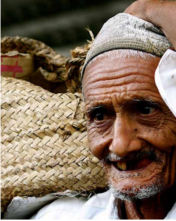
Yaşlı bir balıkçı