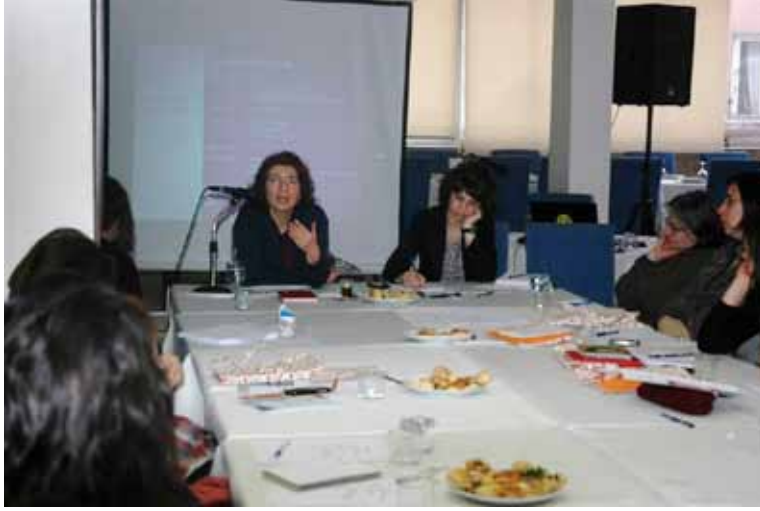
EMO Toplumsal Cinsiyet Atölyesi - 3 Mart 2012 / Ankara

Kadınlar hasbelkader mühendis olsalar dahi eril ideolojilerin mağduru olmaktan asla kurtulamayacaklardır. İş yaşamında aynı işi yaptığı erkek bir mühendis ile aynı ücreti alamamakta veya doğum yaptığı için işten çıkarılabilmektedir. Aynı zamanda kadın mühendisler iş yerinde taciz, tecavüz ve mobbing (psikolojik taciz) vakalarıyla