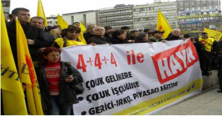
Eğitim-Sen Eylemi - 15 Mart 2012 / Ankara

altı atölyelerde her zaman yer bulacaktır. Üretim belli bir aşamasının evlere taşınması ve esnek çalışma rejimini yaygınlaştıran Ulusal İstihdam Stratejisi ile özellikle kız çocuklarının, anneleri ile birlikte ev eksenli düzensiz ve kayıt dışı çalışma süreçlerine katılımını besleyen 4+4+4 düzenlemesi sermayeye küçük ellerin ucuz emeğini ipotek ediyor.