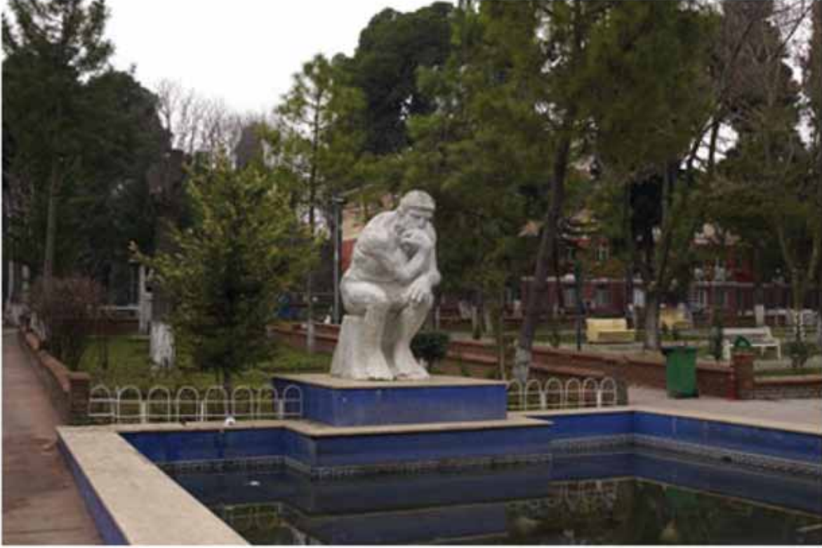
Bakırköy Ruh ve Sinir Hastalıkları Hastanesi Bahçesindeki - Düşünen Adam Heykeli

Bu esaretten çok sıkılıyorum... Eve hiç dönemeyecek miyim, Paul?"