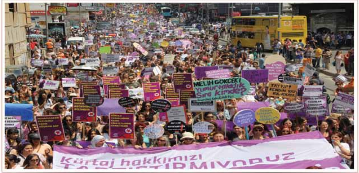
Kadın Eylemi - 30 Nisan 2012 / Ankara