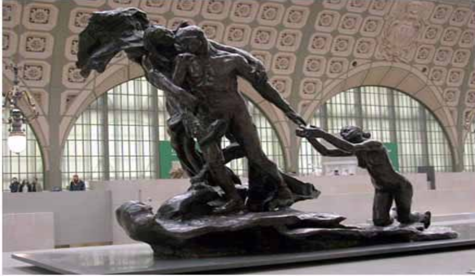
Camille Caludel'in Rodin ile ayrılığını anlattığı "Olgunluk Çağı" adlı eseri

Camille Caludel yaşamı boyunca, diğer yaratıcı sanatçılar gibi deha ile deliliğin sınırları arasında gidip gelmiştir.