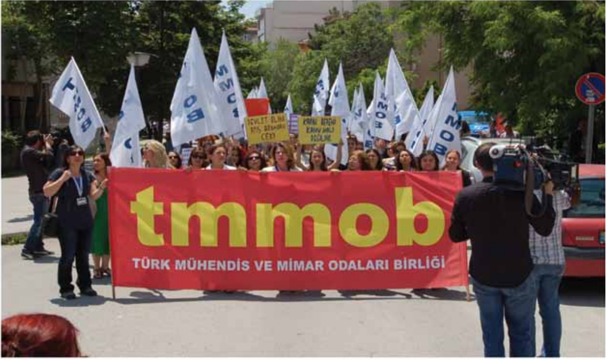
TMMOB Kadın Eylemi - 31 Mayıs 2012 / Ankara

önceki bütün sistemleri tasfiye edip kendini kurarken, patriarkayı içine almış ve işine geldiği gibi şekillendirmiştir. Kapitalist düzen iş gücüne ihtiyacı olduğunda kadını ucuz iş gücü olarak kullanmakta, ihtiyacı olmadığından da kadınları patriarkal ilişkileri kullanarak eve hapsedmektedir. Bunu da toplumsal cinsiyet rollerini yeniden üretmek için yapmaktadır. Toplumda kabul gören erkek işi kadın işi algısının da yardımıyla kadın işlerini önemsiz, kadının zaten yapması gereken işler olarak göstererek ucuza getirmektedir. Bunun toplumda kalıcılığını cinsiyetçi eğitimle, ataeril aile yapısıyla yeniden yeniden üretmektedir. Çarpık tarih bilgileriyle ezelden beri kamu işine yatkın; 'akıl', 'analitik düşünme' gerektiren prestijli işlerin sahibi erkek imgesi yaratılmaya çalışılması patriarka ve kapitalizmin iktidarını perçinlenmektedir.