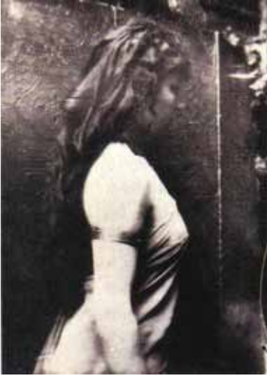
Camille Claudel Rodin için modellik yaparken

Camille ile birlikte olduğu yıllarda yapmıştır. Rodin'in Camille'e ait pek çok eseri sahiplendiği rivayet edilmektedir. Bu eserden sonra Rodin, Camille'i heykeltıraşlıkta kendine bir rakip olarak görmeye başlar. Ona delicesine bir tutkuyla aşık olan Camille, gerçeği başlangıçta çok fazla kabul etmek istemese de Rodin'in sonradan kabalaşan ve değişen tavırları ile durumun farkına varacaktır.