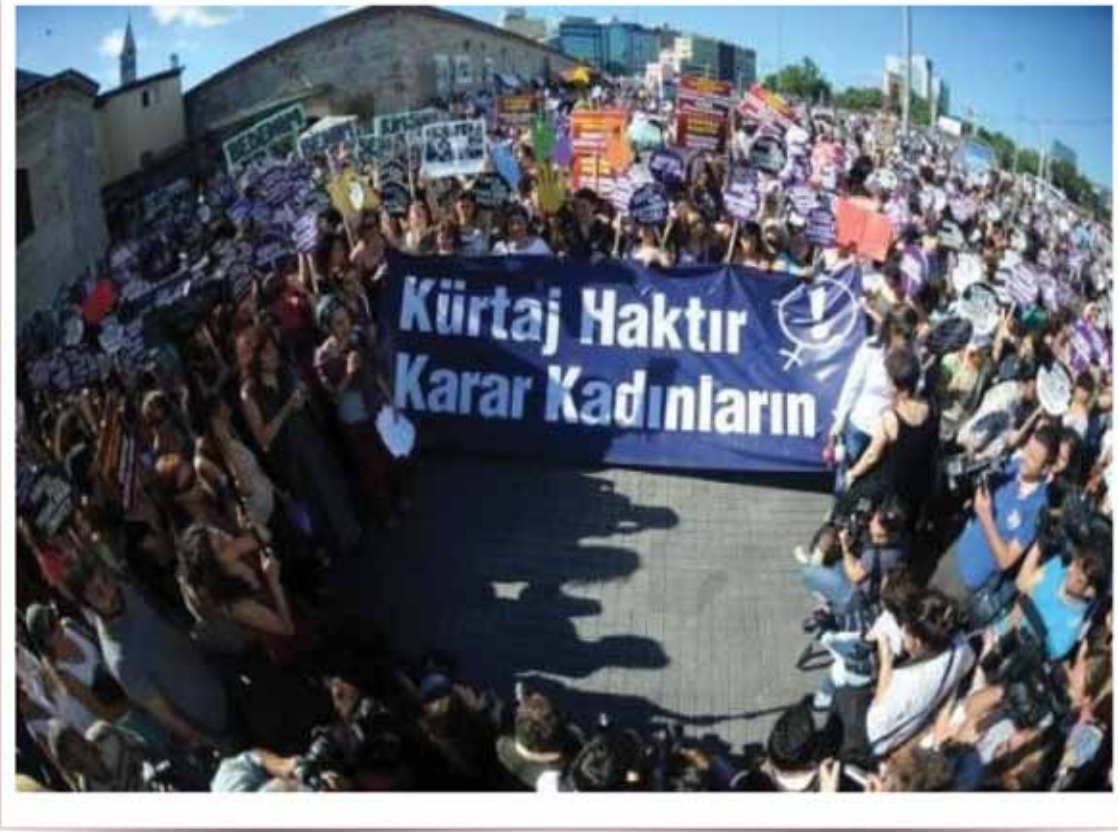
Kadın Eylemi - 17 Haziran 2012 / İstanbul

Muhafazakârlaşan toplumumuz, bütün kapalı toplumlar gibi günden güne sapkınlaşmaktadır. Kadın ve çocuklara yönelik şiddet, tecavüz, cinsel istismar gibi olayların giderek artması, faille-