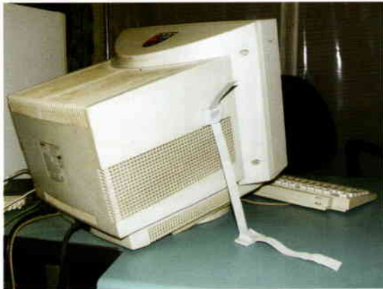
TV, bilgisayar gibi düşebilecek eşyaların sabitlenmesi