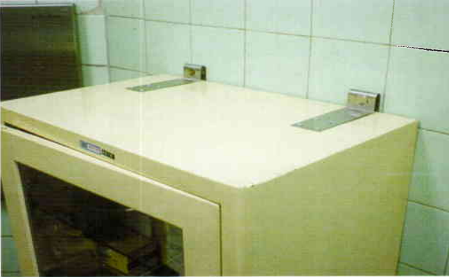
Dolabın duvara sabitlenmesi