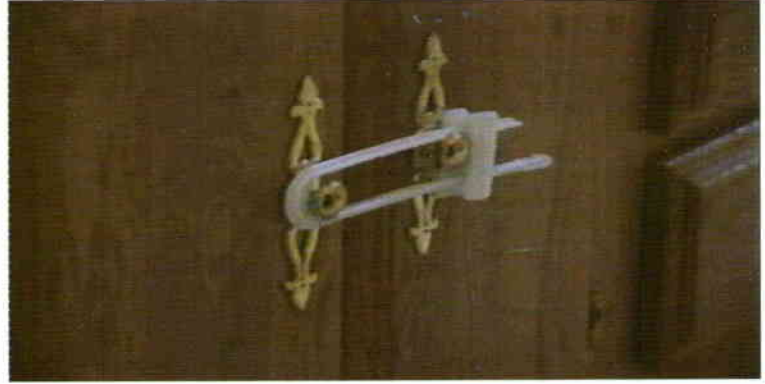
Dolap kapaklarının kapalı tutulması