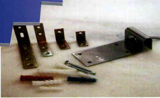
Dolap ve benzeri şeyleri sabitlemede kullanılan malzemeler