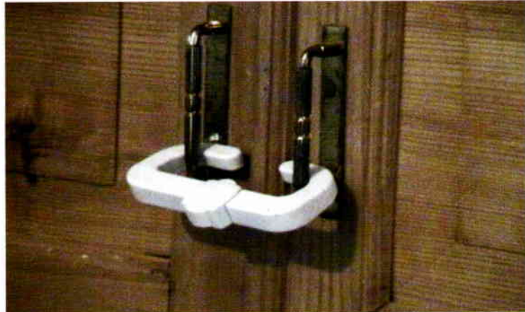
Dolap kapaklarının kapalı tutulması