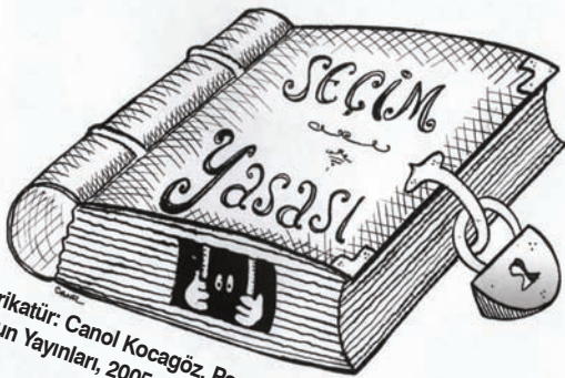
Karikatür: Canol Kocagöz, Panikatak, Sorun Yayınları, 2005

"Kendisi de 12 Eylül rejiminin ve 28 Şubat sürecinin bir ürünü olan AKP, 12 Eylül rejimiyle, darbelerle hesaplaştığı aldatmacasıyla emperyalizmin soğuk savaş döneminin koşullarına göre şekillendirdiği askeri ve-