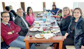
8 Mart Dünya Emekçi Kadınlar Günü nedeniyle Kartepe Green Park Otel'de gerçekleştirilen kahvaltıda katılan kadınlar, birlikte sohbet etme imkanı buldu, güzel bir gün geçirdi.