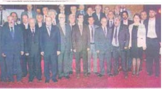
60, 50, 40 ve 25 yıl geride bırakan elektrik mühendisleri plaketleri aldılar. Plaketlerini alanlar daha sonra kutlamaya bir araya geldiler. Bu arada, geçen yılın en başarılı öğrencileri de ödüllendirildi.