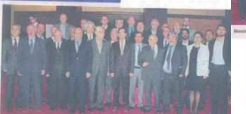
NİCE YILLARA - Meslekte 25-40-40 ve 60 yıl geride bulunan elektrik mühendisleri plaket töreni.