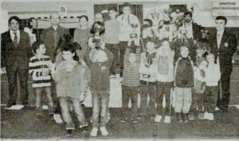
Turnuva sonunda dereceye giren sporcular toplu olarak habire fotoğrafı çaktırdı.