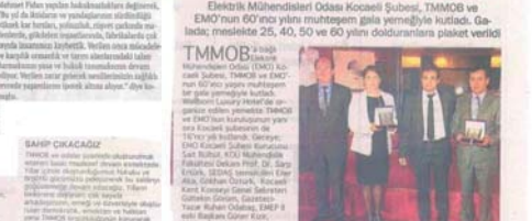
EMO'dan muhteşem gala Elektrik Mühendisleri Odası Kocaeli Şubesi, TMMOB ve EMO'nun 60'ncü yaşını kutlamak için muhteşem bir gala düzenledi. Geçmişte 60, 50, 40 ve 25 yıl geride bırakanlara plaket verildi.

Elektrik Mühendisleri Odası Kocaeli Şubesi, TMMOB ve EMO'nun 60'ncü yaşını kutlamak için muhteşem bir gala düzenledi. Geçmişte 60, 50, 40 ve 25 yıl geride bırakanlara plaket verildi.