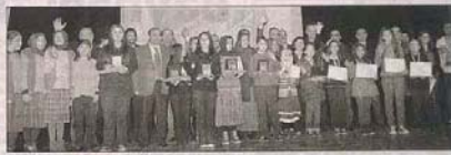
ÖDÜL ALANLAR: Elektrik Mühendisleri Kocaeli Şubesi tarafından düzenlenen resim ve öykü yarışmasında dereceye giren öğrenciler, jüri üyeleri, okul idarecileri ve veliler toplu halde görüldü.