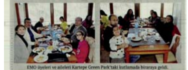
EMO üyeleri ve aileleri Kartepe Green Park'taki kutlamada biraraya geldi.