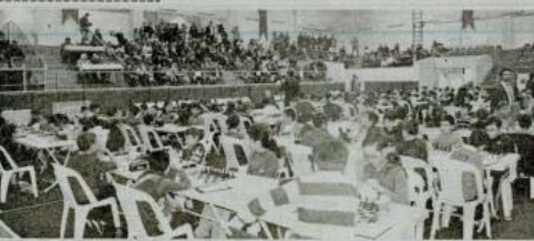
EMO Kocaeli Şubesi'nin geleneksel olarak düzenlediği Cumhuriyet Kupası Satranç Turnuvası, Derince Spor Salonu'nda yapıldı.