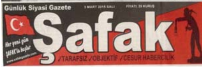
Sayfa 9: Sağ - Orta