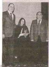
Oydu dalında verilen tüm Ödülleri Güzeltape Fevzi Çakmak Anadolu Lisesi'nin öğrencileri aldı.

EMO Kocaeli Şubesi'nin düzenlediği 'Elektrik Enerjisi Tasarrufu Verimliliği ve Çevre Üzerine Etkileri' konulu resim ve öykü yarışması ödülleri sahiplerini buldu.