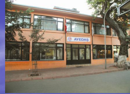
Adalar İşletme Müdürlüğü