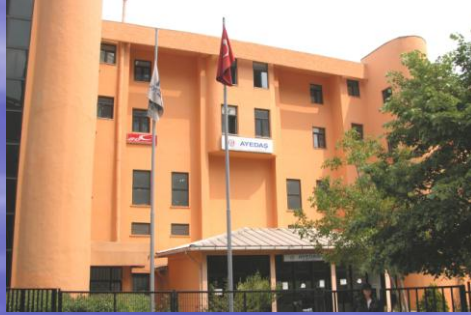
Erenköy İşletme Müdürlüğü