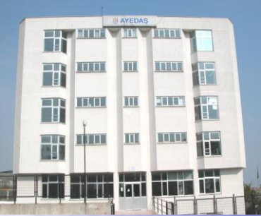
Kartal İşletme Müdürlüğü