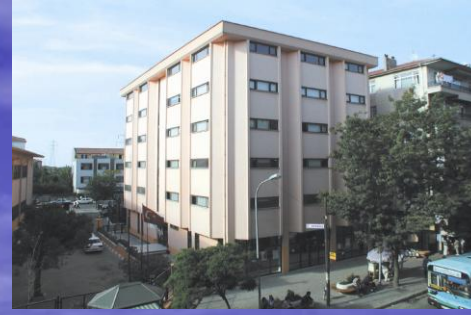
Ümraniye İşletme Müdürlüğü