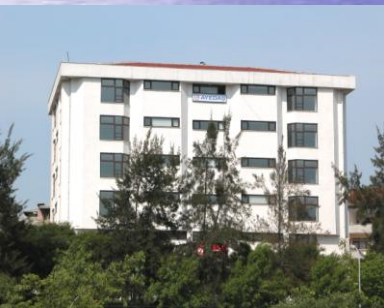
İçmeler İşletme Müdürlüğü