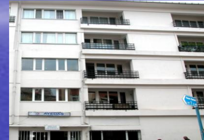
Kadıköy İşletme Müdürlüğü