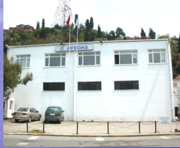
Vaniköy İşletme Müdürlüğü