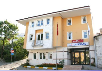
Sile İşletme Müdürlüğü