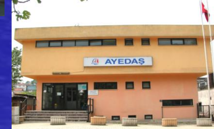
Beykoz İşletme Müdürlüğü