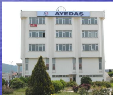
Samandıra İşletme Müdürlüğü