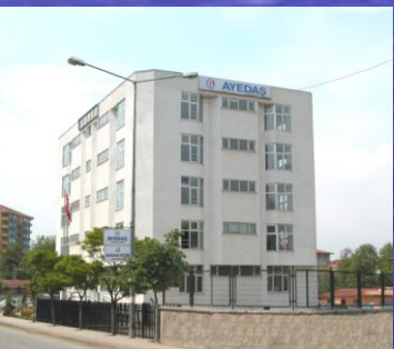
Dudullu İşletme Müdürlüğü