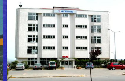
Kurtköy İşletme Müdürlüğü