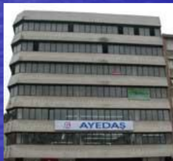
Üsküdar İşletme Müdürlüğü