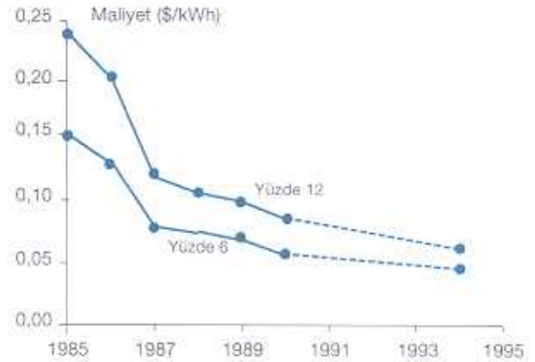
ŞEKİL 1: Kaliforniya'daki rüzgar türbinlerinden üretilen elektriğin maliyetinin düşüşü; veriler 1994 için (1,2) tahmin ediyor. (a)Ortalama rüzgar enerji yoğunluğu >450watt/m 2 , Kaliforniya'da geçilen için tipik değer (b) İşletim ve bakım masrafları (2)'den, (c.) U.S. rüzgar gücü'nün (Windpower) dosyalarına dayanarak, Kaliforniya Enerji Komisyonu'nun U.S. rüzgar gücünün 33MV-S değişken hızlı türbininin 1994 yılı maliyet tahmini, U.S. rüzgar gücü tarafından işletme ve bakım artı toprak kira bedeli kWh başına 0.0104 dolar olarak belirtmiş. Saha deneyimlerinden edindiğimiz bilgilere göre işletme ve bakım maliyetlerinin şu andaki endüstriyel averaj olan kWh başına 0.01 dolar seviyesinin altına inmesi bekleniyor. Değişken-hızda çalıştırmanın en büyük avantajı türbin parçalarının üzerindeki stresin ve metal yorgunluğunun azaltılması ve bunun sonucu olarak bakım masraflarının azalmasıdır.

kaç katı kadar elektrik üretme potansiyeline sahip rüzgar olduğu hesaplandı (4). Ve Birleşik Devletler'de mantıklı varsayımlar ve rüzgar türbini için elverişli alanlar düşünüldüğünde, iki eyalet, Kuzey Dakota ile Güney Dakota'nın elektrik potansiyellerinin, ABD'nin şu anki elektrik tüketiminin yüzde 80'i olduğu hesaplanmıştır. (5)