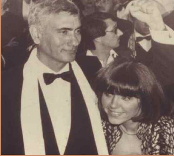
Cannes Ödül Töreni 1982

Can YÜCEL Yukardalar adlı şiirinde o günü şöyle anlatmaktadır;