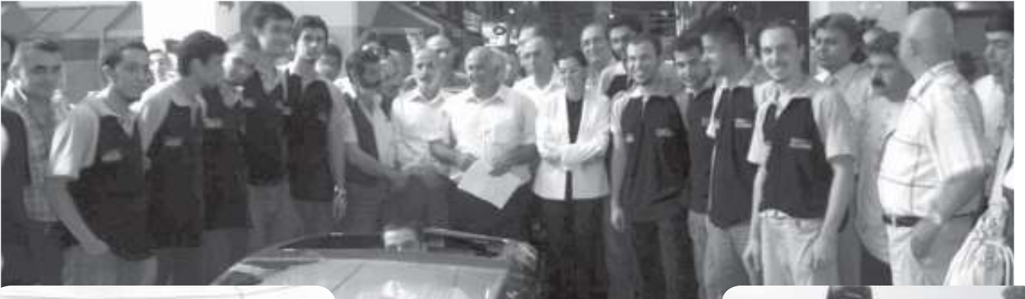
Hidramız Kamuoyunun Karşısına Çıkıyor