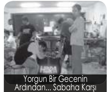
Yorgun Bir Gecenin Arından... Sabaha Karşı