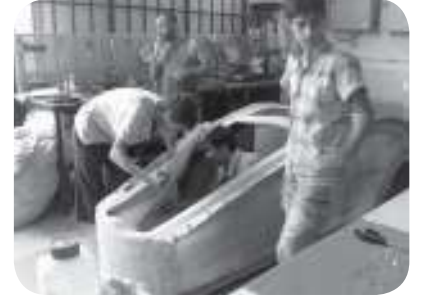
Boya da Çok Şık Oldu