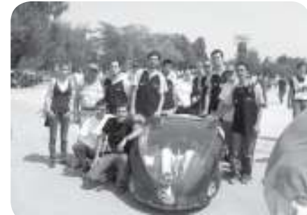
Her Başarıya Hatıra Fotoğrafları Gerekir