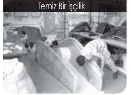
Temiz Bir İşçilik