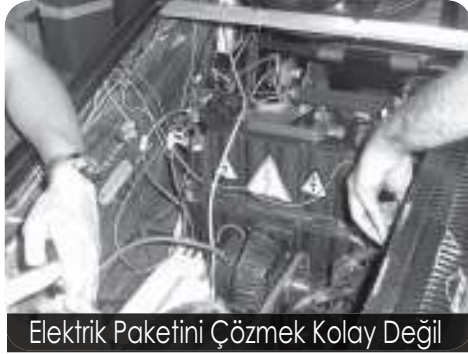
Elektrik Paketini Çözmek Kolay Değil