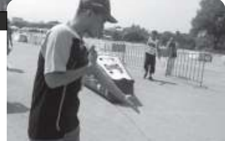
Start Zamanı Geldi