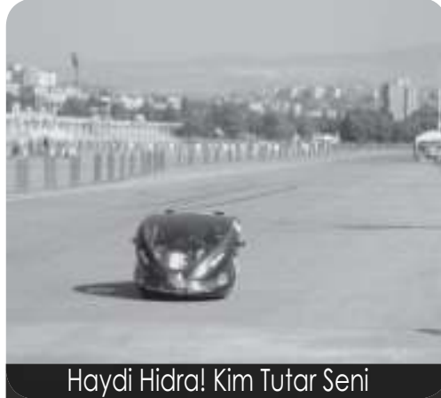
Haydi Hidra! Kim Tutar Seni