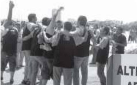
Şimdi Sevinç Zamanı