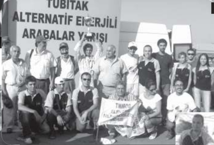
Kupa Gururunu Yaratanlar Toplu Halde