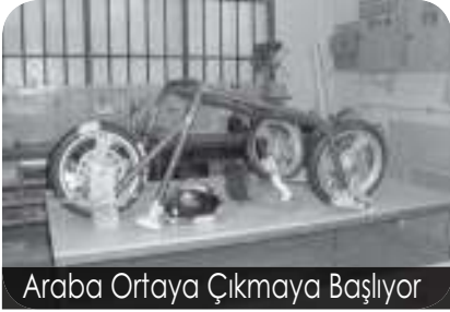
Araba Ortaya Çıkmaya Başlıyor