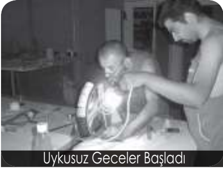
Uykusuz Geceler Başladı