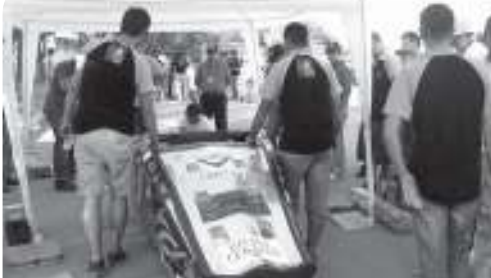
Yavaş Yavaş Piste Çıkma Zamanı