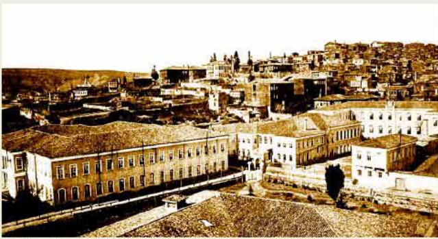
Mühendishâne-i Berrî Hümayûn Halıcıoğlu'ndaki Mühendishane binaları