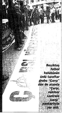
Beşiktaş futbol kulübünün ünlü taraftar grubu "Çarı" din de alabildiği "Çarı nükleer santrale karşı" pankartıyla yer aldı.