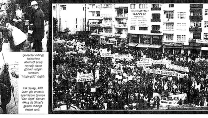
Cevreciler minge halklarına alternatif enerji kaynağı olarak güvenli nükleer santrali "trazgulu" dıgıtı. AKM Samsun, AKM Günen gibi protesto gösterileri zamanları "Deniz Akçın" Osman Akıng da Sino'a gelecek minge destek veriz.