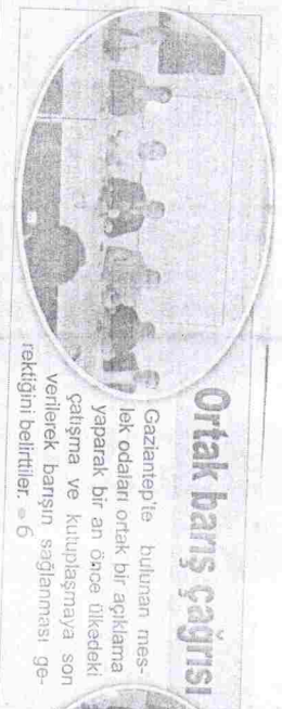
Gaziantep'te bulunan meslek odaları ortak bir açıklama yaparak bir an önce ülkedeki çatışma ve kutuplaşmaya son verilerek barışın sağlanması gerektiğini belirttiler. 6

Bizler; Demokrasi, özgürlük ve Barış'ın yanında olduğumuzu ilan ediyor, savaşlarda kazanan taraf olmadığı bilinciyle yurttaşlarımızı barışa sahip çıkmaya, ülkenin geleceğini karartmaya çalışanlara karşı seslerini duyurmaya, her zamankinden daha fazla ihtiyaç duyduğumuz barış, kardeşlik ve dostluk içerisinde olmaya çaba göstermeye davet ediyoruz. 30 Ağustos Zafer Bayramının akabinde kutladığımız Barış Günü'nde Ülkemizin Bağımsızlığını ve Kurtuluşunu pek çok farklı dinden, dilden ve etnik kökenden oluşan yurttaşlarımızın ortak vatan sevgisine ve inancına, tek yürek olabilmelerine borçlu olduğumuzu unutmadan, yaşananlardan dersler çıkarmalıyız. Dünyada ve yaşadığımız coğrafyada ki, Kan, zulüm, savaş, şiddet dolu döneme son verilmesi için çaba sarf etmeye, Mustafa Kemal Atatürk'ün; "Yurtta Sulh Cihan'da Sulh" sözü ışığında; din, dil, ırk ayırmanın ülkemizin sağduyulu insanlarını, yöneticilerini bir kez daha Barışa, Dostluğa, Kardeşliğe ve insanca bir yaşama sahip çıkmaya davet ediyoruz. Can kayıplarının sonlandırılması için bütün kesimlerin barıştan yana tavır almasının insani ve tarihsel bir sorumluluk olduğunu hatırlatırken, Tüm yurttaşlarımızın, Gaziantepililerin ve meslektaşlarımızın "Dünya Barış Günü"nü kutluyor, Barış Günü'nde tüm Dünyada göz yaşlarının sona ermesini diliyoruz" denildi.