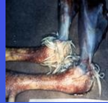
Deride ve kaslarda kanamalar