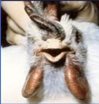
İbik ve sakallarda ödem, siyanoz ve kanamalar