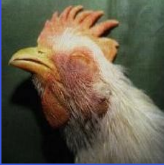
Hırıltılı ve güç solunum