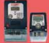
Çok Tarifeli Elektronik Elektrik Sayacı Trifaze - Monofaze 10(60)A