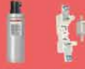
Kondansatörler 167kVar - 50kVar