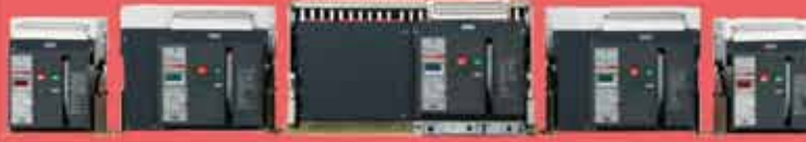
Açık Tip Devre Kesiciler 63A - 5000A