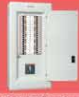
EasyPan® Dağıtım Panosu 1 Kutuplu, 12-36 Yolu