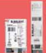
Dijital Elektronik Balastlar