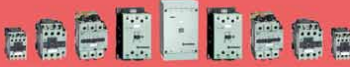
Kontaktörler 6A - 750A