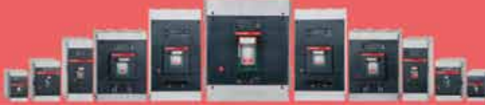
Kompakt Tip Devre Kesiciler 16A - 2500A