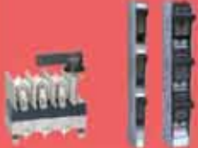
Yük Ayırıcılar (Sigortalı - Sigortasız) 160A - 1250A