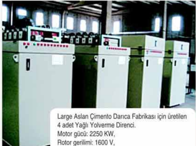
Large Aslan Çimento Darıca Fabrikası için üretilen 4 adet Yağlı Yolverme Direnci. Motor gücü: 2250 KW, Rotor gerilimi: 1600 V, Rotor akımı: 780 A

Bakım ihtiyacı çok az olan bu tip dirençler özellikle çimento fabrikalarındaki birkaç MW güce sahip olan motorların devreye alınmasında kullanılmaktadır. Motor gücü, Rotor akımı ve Rotor gerilimi değerleri ile motorun kullanım yeri ( Değirmen, Su pompası, Fan v.s) bildirildiğinde, her güç ve devirdeki motorlar için Yağlı Yolvericiler garantili olarak imal edilmektedir.