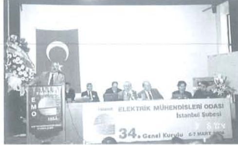
Şubemiz 34. Genel Kurulu Divanı