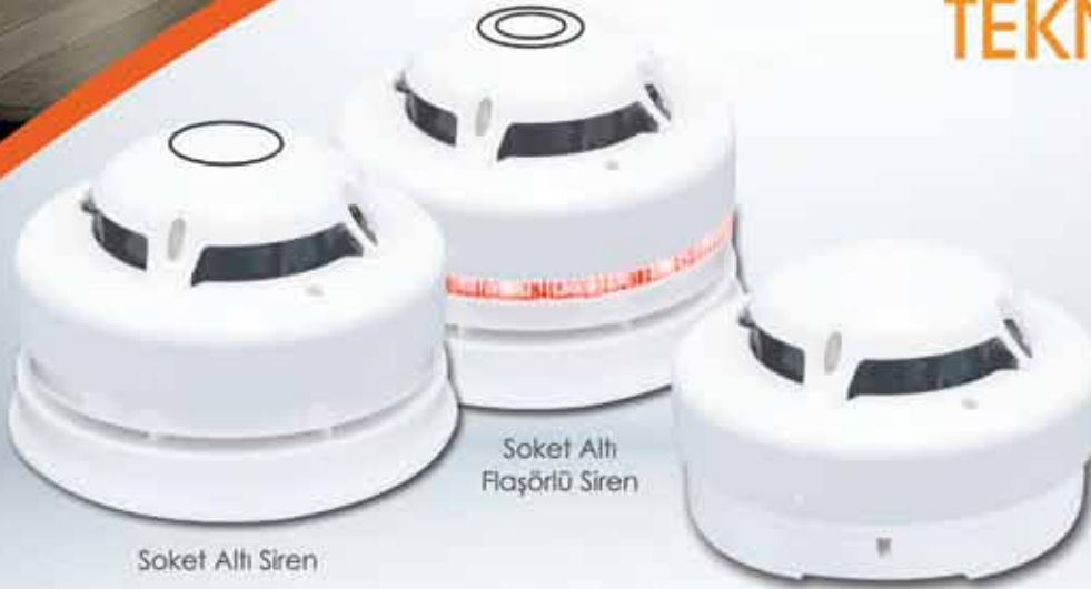
Soket Altı Siren