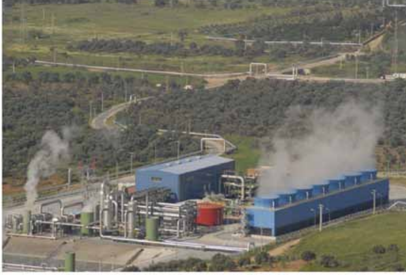
Fotoğraf 11 Tarım sahaları arasına kurulan jeotermal enerji santrali ve iletim hatları.

cek patlamalar ya da fıskırmalar hem toprak hem de su kaynaklarını etkilemektedir.”