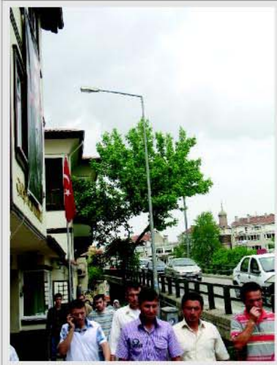
3 "UEDAŞ kiremitleri bile aydınlatıyor"