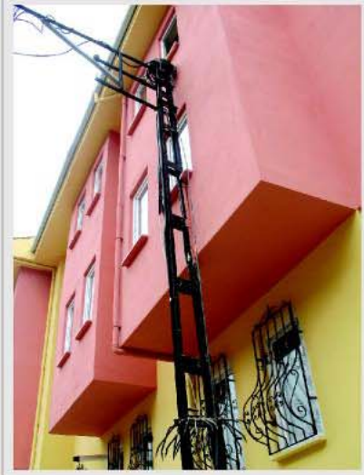
2 "Deprem güçlendirmesi mi?"