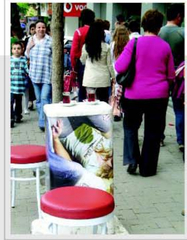
"Kablo TV panosu mu, kaldırım kahvesi mi?" 3