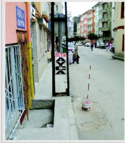
5 "Ortada kuyu var yandan geç"