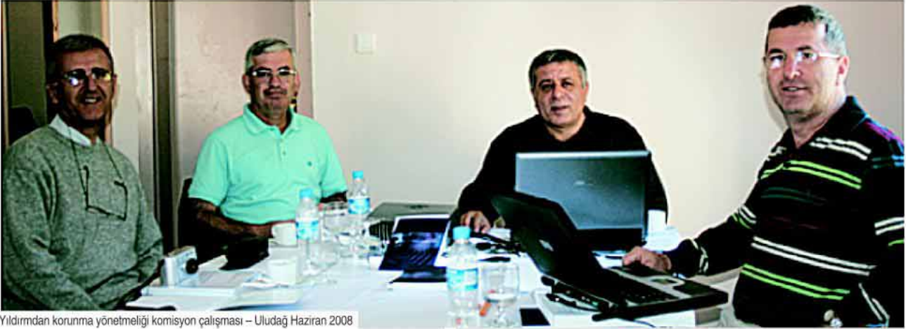
Yıldırımdan korunma yönetmeliği komisyon çalışması – Uludağ Haziran 2008

Ben de katıldım. Ülke çıkarları açısından çok önemli ve acil bir konu olarak gördüğü yıldırımdan korunma sistemlerinin sağlıklı ve güvenli bir zemine oturabilmesi için, biz dört yoğun komisyon üyesini biraraya getirme ve çalışmalarını yürütme konusundaki sabırlı, kararlı ve özverili çabaları üstlendiği görevlerdeki sorumluluk anlayışını vurgulayan en tipik örneklerden biridir.