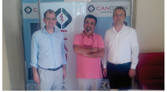
Can Ozan Pano Ltd. Şti.