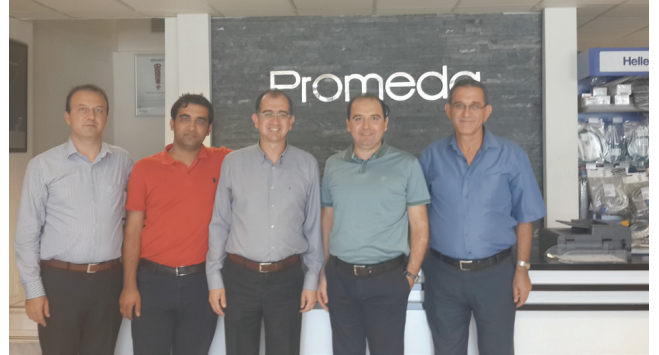
Promeda Ltd. Şti.