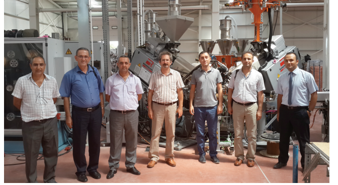
Reber Kablo Ltd. Őti.