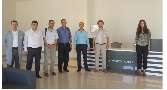
Hastel Kablo Ltd. Őti.

ve uluslararası uzmanların katılımının önemli olduĐu, bu nedenle 2015 yılındaki etkinlikte de benzer uygulamanın devam etmesi yönünde gürüŐ bildirdiler.