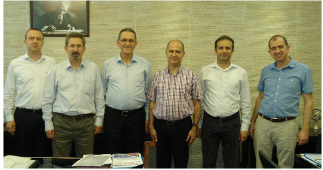
Akman Enerji Ltd. Şti.