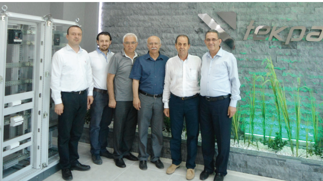
Tekpan Ltd. Şti.