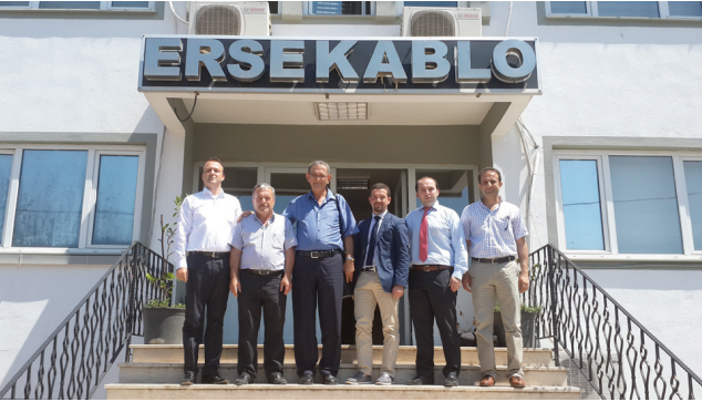
Erse Kablo Ltd. Şti.