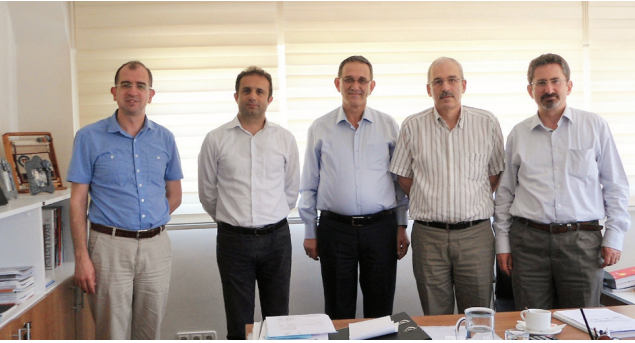
Uyan Elektrik Ltd. Şti.