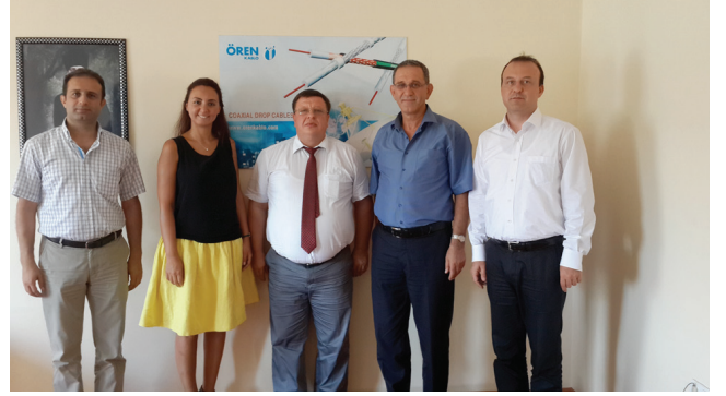
Ören Kablo Ltd. Şti.