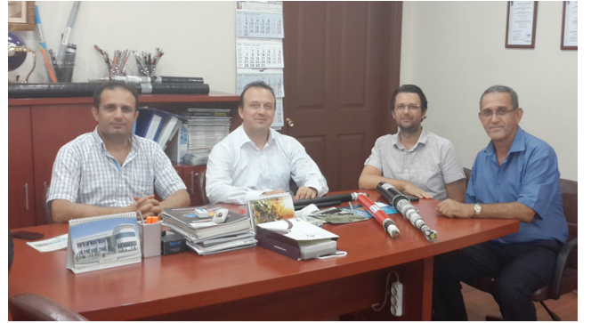
Etabir Kablo A.Ş.