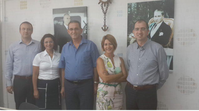
Ergun Elektrik A.Ş.

olacağını, üretici, projeci, satıcı, kontrol ve kullanıcıların biraraya geleceği etkinlikte yer alacaklarını belirttiler.