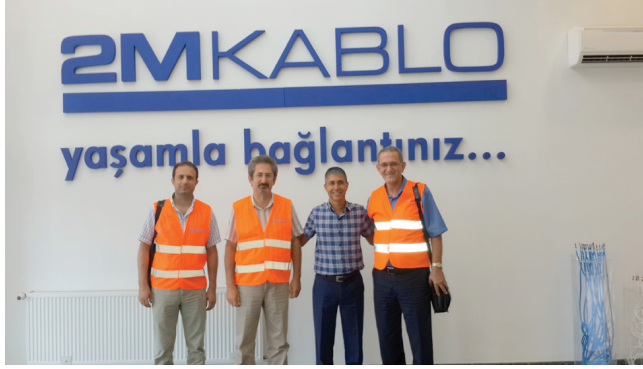
2M Kablo A.Ő.