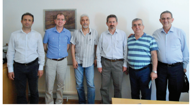
Batel Elektromekanik A.Ş.