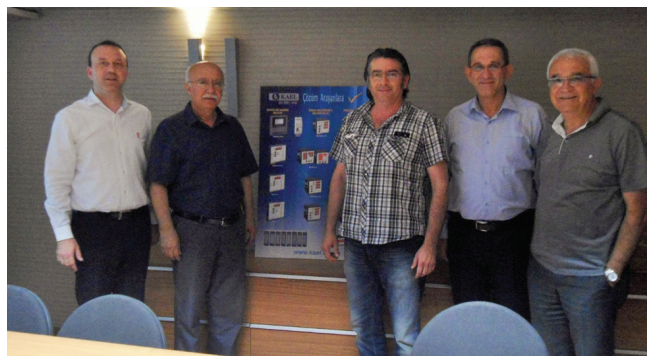
Kael Mühendislik Elektronik Ltd. Şti.