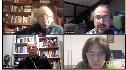
Kamusal Söyleşiler: Enerji Yoksulluğu ve Yeniden Kamulaştırma

“Bir piyasanın rekabete açılıyor olması, ne yazık ki rekabetin tesisini ve rekabetteki