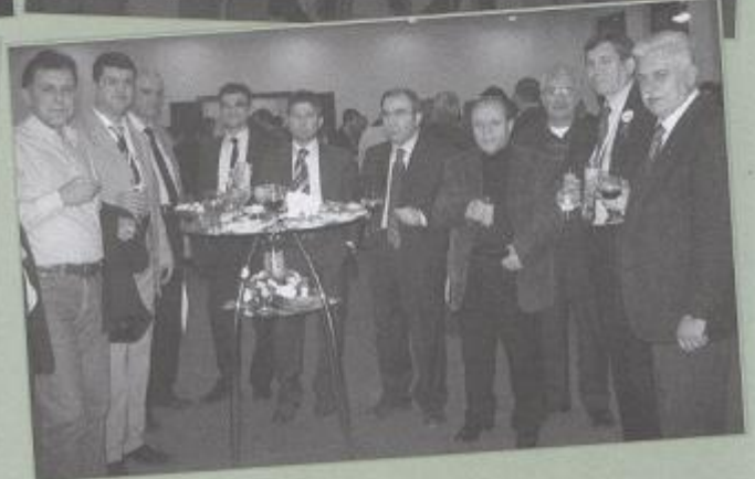
Eleco'2005 Açılış Kokteyli