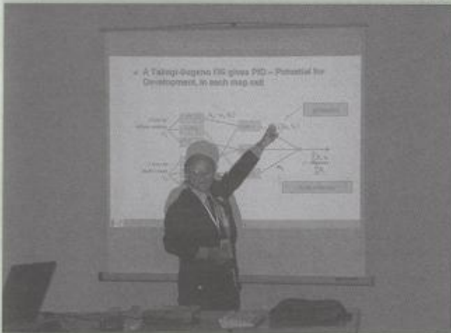
Çağrılı Bildiri Sunumu