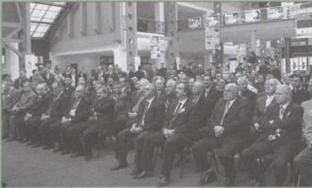
Eleco'2005 Fuar Açılışı

dünya ekonomisinin üretim kaynaklarını çekişi karşısında ABD'nin yeni teknolojik atılımlar yapma zorunda oluşunu vurguladı. Ayrıca her ülkenin kendi içinde teknolojik gelişimi takip etme ve üretmeye