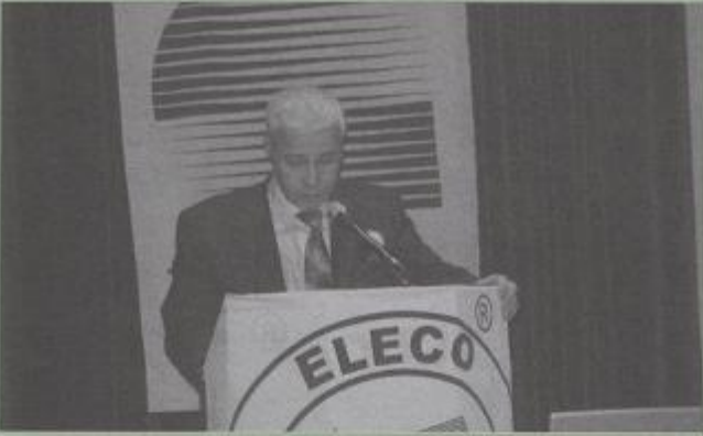
EMO Genel Başkanı Kemal ULUSALER

yayılmında önemli bir yeri olduğunu ve Elektrik Mühendisleri Odasının tüm şubelerinin enerji alanındaki konularda sempozyumlar düzenledikleri ve düzenlemeye devam edeceklerini belirtti.