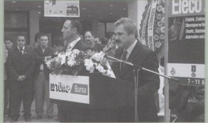
Bursa Valisi Nihat GANPOLAT

Buttim Kültür Merkezinde gerçekleşen Kongre Açılışından sonra saat 12.00'de Fuar açılışı gerçekleştirildi.