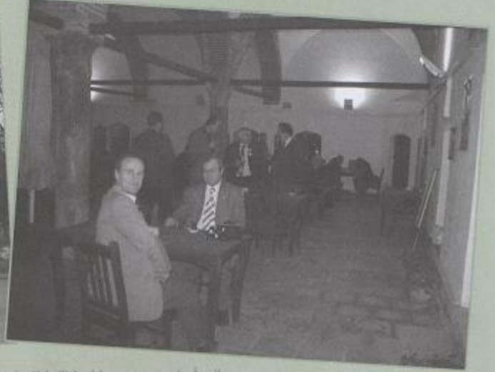
Saat: 14.25 itibariyle Kongrenin sosyal etkinlikleri kapsamında İznik ve Cumalıkızık'a geziler düzenlendi. Totaş Otomobil Fabrikalarına ise teknik gezi yapıldı.