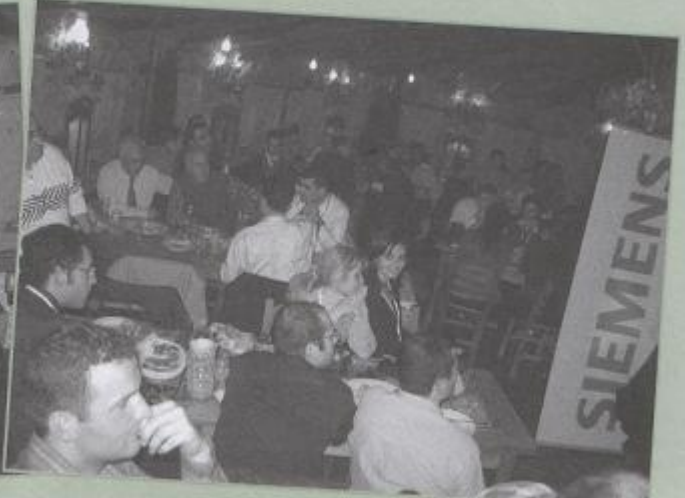
İkinci günü akşamı Siemens'in sponsorluğunda Köy Restaurantta Eleco'2005'e katılan tüm araştırmacı ve öğretim üyelerine yemek verildi.