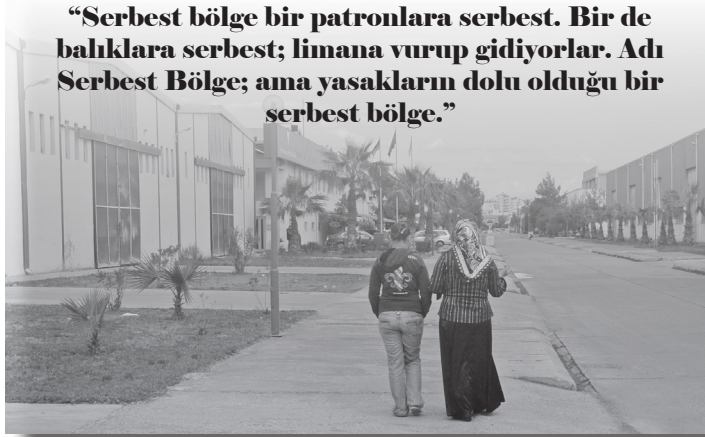
“Serbest bölge bir patronlara serbest. Bir de balıklara serbest; limana vurup gidiyorlar. Adı Serbest Bölge; ama yasakların dolu olduğu bir serbest bölge.”