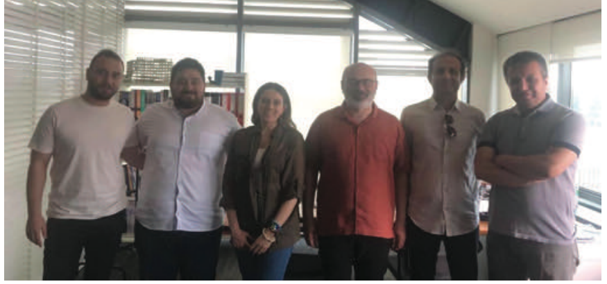
ABB Orta Gerilim Metalclad Panolar ve Yeni Teknolojiler Semineri

AYC Mühendislik ziyareti 20 Haziran 2023 tarihinde gerçekleştirildi. Ziyarete, SMM üyelerin proje onay süreçlerinde yaşadığı sorunlar, işletme sorumluluğu hizmetlerine ilişkin değerlendirmeler yapıldı.