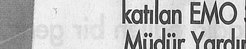
Basit tedbirlerle büyük tasarruflar sağlanabilir