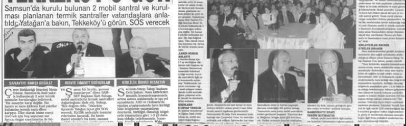
Samsun'da kurulu bulunan 2 mobil santral ve kurulması planlanan termik santraller vatandaşlara ulaştırıldı. Yatığa'nı bakın, Tekkeköy'ü görün. SOS verecek