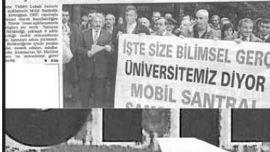
Samsun Çevre Birlikleri üyeleri, mobil santrale karşı çıkan çevreciler, 'Kamuoyunu bilerek ve isteyerek yanıltmaya çalışıyorlar, artık Samsunluların yüzüne bakamayacakları' diye haklıydılar

Samsun Çevre Birlikleri üyeleri, mobil santrale yönelik protesto eylemine, OMÜ'nün açtığı 'Çevre Kirliliği Raporu' damgasını vurdu. Elindeki dövizlere santrale karşı çıkan çevreciler, 'Kamuoyunu bilerek ve isteyerek yanıltmaya çalışıyorlar, artık Samsunluların yüzüne bakamayacakları' diye haklıydılar