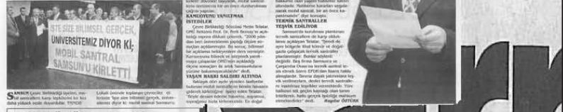
Samsun Çevre Birlikleri üyeleri, mobil santrale karşı çıkan çevreciler, 'Kamuoyunu bilerek ve isteyerek yanıltmaya çalışıyorlar, artık Samsunluların yüzüne bakamayacakları' diye haklıydılar

Samsun Çevre Birlikleri üyeleri, mobil santrale yönelik protesto eylemine, OMÜ'nün açtığı 'Çevre Kirliliği Raporu' damgasını vurdu. Elindeki dövizlere santrale karşı çıkan çevreciler, 'Kamuoyunu bilerek ve isteyerek yanıltmaya çalışıyorlar, artık Samsunluların yüzüne bakamayacakları' diye haklıydılar