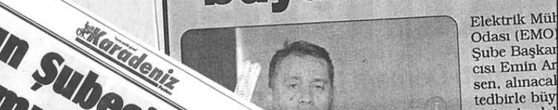
Basit tedbirlerle büyük tasarruflar sağlanabilir