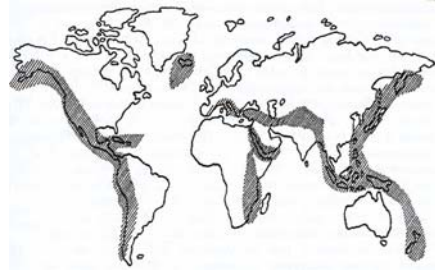
Şekil 2. Jeotermal Enerji Kaynaklarının Coğrafi Dağılımı