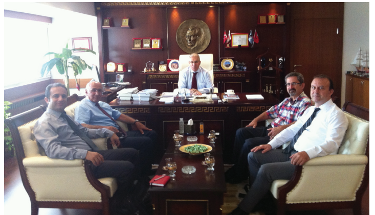
Elektrik Üretim A.Ş.