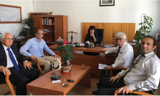
TCCD Genel Müdürlüğü