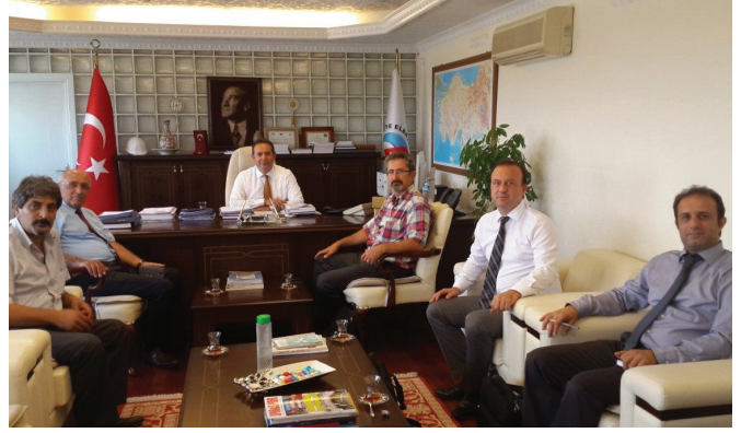
Türkiye Elektrik Dağıtım A.Ş.