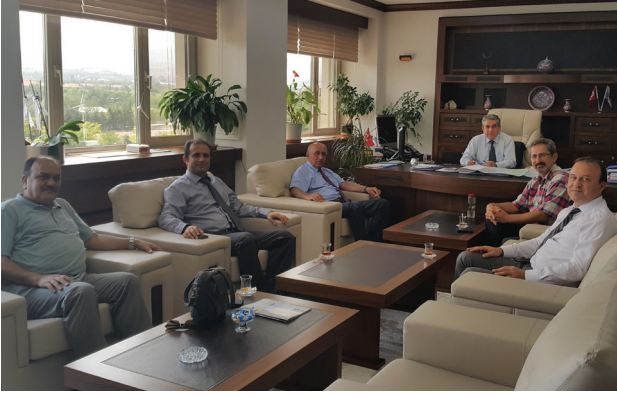
Türkiye Elektrik İletim A.Ş.

elektrik ve elektronik sektörünün bütününe içerisinde alan birçok güncel konunun işleneceği etkinliğimize ilişkin hazırlanan taslak program hakkında bilgilendirme yapılarak kurum bünyesinde ilgili personelin katılımın sağlanması talep edildi.