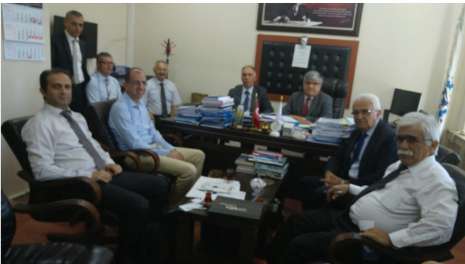
İş Teftiş Kurulu Başkanlığı