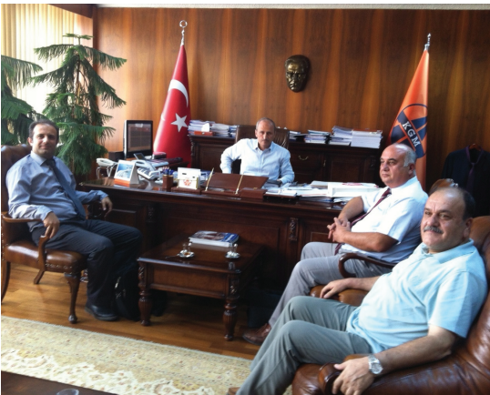
Karayolları Genel Müdürlüğü