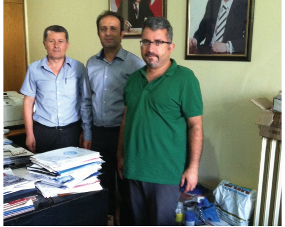
Ankara Su ve Kanalizasyon İdaresi