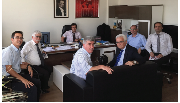
TSE Belgelendirme Dairesi Başkanlığı