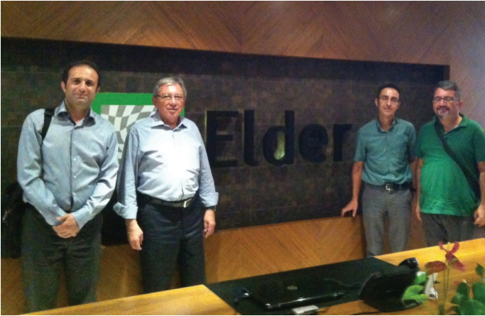
Elektrik Dağıtım Hizmetleri Derneği