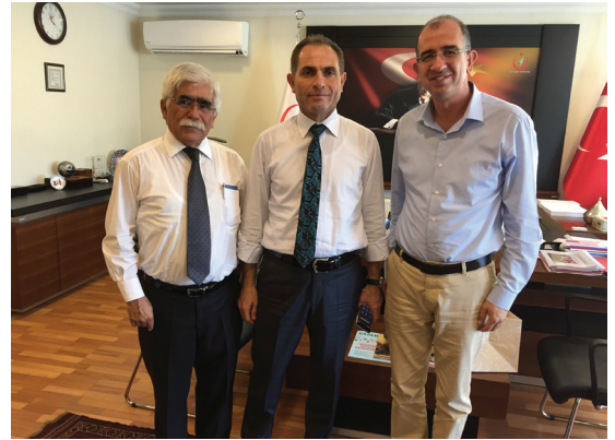
Sağlık Bakanlığı Sağlık Yatırımları Genel Müdürlüğü