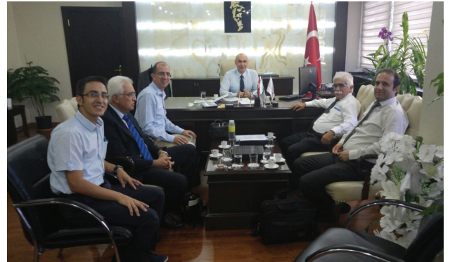
ETKB Maden İşleri Genel Müdürlüğü