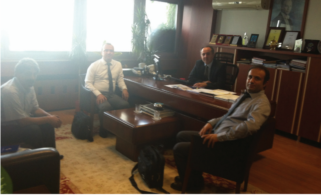
Yenilenebilir Enerji Genel Müdürlüğü