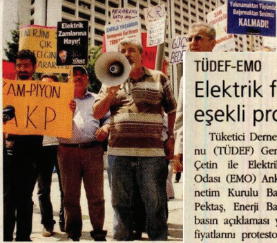
TÜDEF ve EMO'nun Enerji Bakanlığı önünde "Yolumadık tütümüz kalmadı, Zam-PIYON /