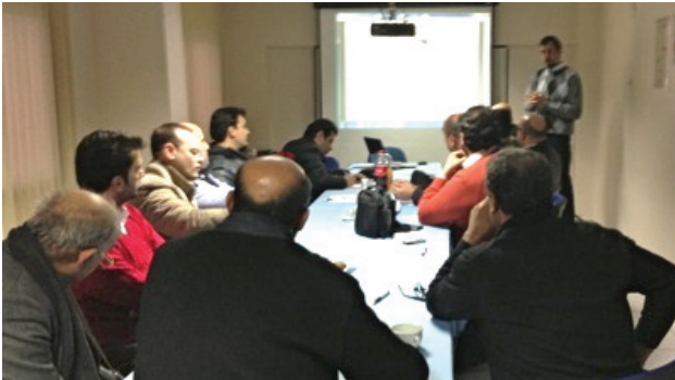
EMO Manisa İl Temsilciliği