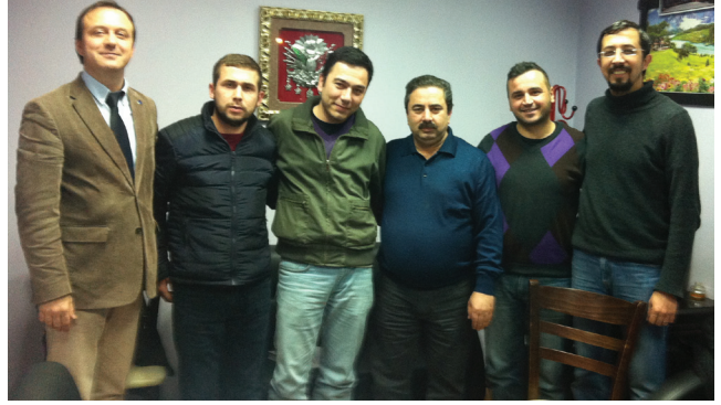
EMO Torbalı İlçe Temsilciliği