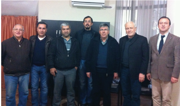
EMO Ödemiş İlçe Temsilciliği