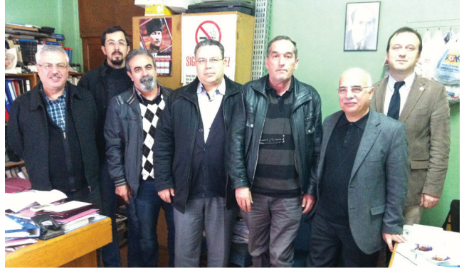
EMO Tire İlçe Temsilciliği