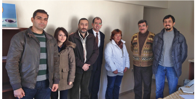
EMO Kuşadası İlçe Temsilciliği