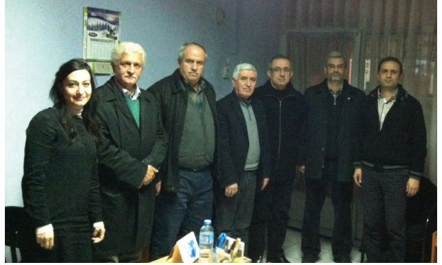
EMO Turgutlu İlçe Temsilciliği

2014 yılı en az ücret tanımlarına yönelik olarak SMM üyelerin bilgilendirilmesi amacıyla 16 Aralık 2013 tarihinde Akhisar ve Manisa temsilciliklerinde, 18 Aralık 2013 tarihinde Aydın ve Nazilli temsilciliklerinde, 23 Aralık 2013 tarihinde Kuşadası, Söke ve Didim