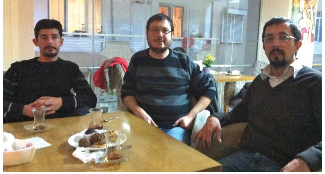
Dikili - SMM Üyeler