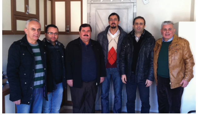
EMO Alaşehir İlçe Temsilciliği