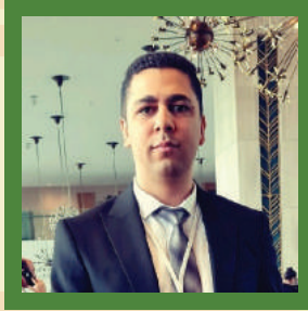
Oğuzhan Oğuz Enerji ve Tabii Kaynaklar Bakanlığı