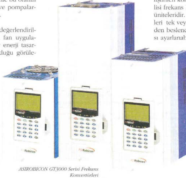
ASIROBICON GT3000 Serisi Frekans Konvertörleri

Bir tesiste 380VAC, 400kW, 1485 d/d asenkron sincap kafesli motor ile tahrik edilen fanlar kullanılmaktadır. Söz konusu fanlara yıldız/üçgen yol verilmektedir. Debi