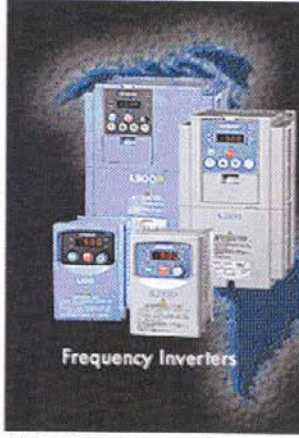
Hitachi Frekans Konvertörleri

Almanya'da uygulamaya sokulan hız kontrol üniteleri ve yüksek verimli motor kullanılması ile enerji tasarrufu uygulamalarında, bir elektrik motorunda yaklaşık % 40 enerji tasarrufu sağlanmakta ve bu yöntemler tüm motorların %30'unda kullanılmaktadır.