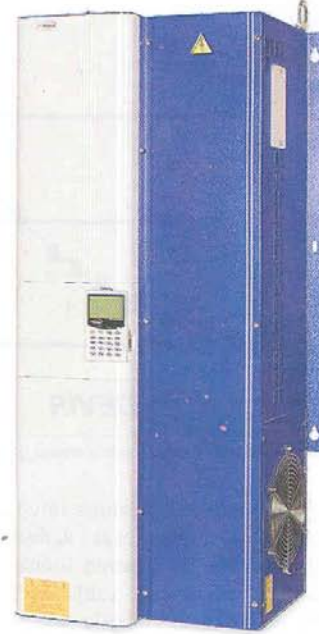
ASI-Robicon GT3000 Serisi Frekans Konvertörü

Görüldüğü gibi %10 civarı devir ayarı ile sağlanan enerji tasarrufu yıllık 20.796$'dır. Tablo 2'de frekans konvertöründeki enerji kayıpları da hesaba katılmıştır. Frekans konvertörünün maliyeti