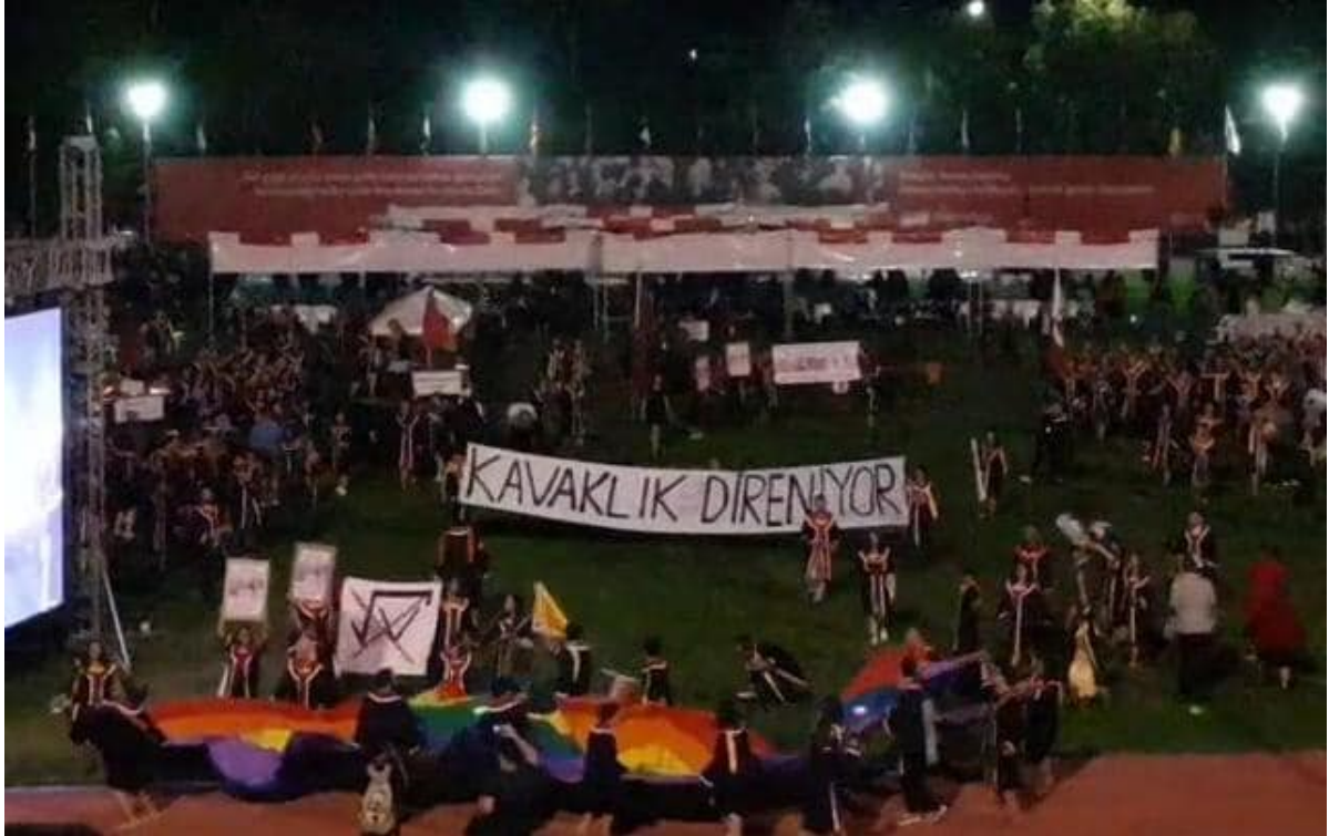
Şekil 1. Mezuniyet töreni,2019

ODTÜ öğrencileri olarak KYK yurdunu istemememizin çeşitli sebepleri vardır. Başlıca sebep, KYK yurdunun bir Truva Atı gibi ODTÜ'ye sokulmak istenmesidir. Bu yurt, iktidar tarafından seçilerek yerleştirilecek öğrenciler yoluyla, ODTÜ'de karışıklık ortamı yaratmak için kullanılacaktır. Üniversite yönetimi ve KYK arasında imzalanan protokolde, yurda yalnızca ODTÜ öğrencilerinin yerleştirileceği ibaresi yer alsa da , bu durumun böyle olmayacağı ve yol için imzalanan protokolün nasıl ihlal edildiği kamuoyunca bilinmektedir. 61 tane KYK yurdu projesinin 60 tanesi ekonomik kriz sebebiyle başlatılmazken, yalnızca ODTÜ'de bir projenin başlatılması , bunu bir yurt projesinden ibaret olmadığını göstergesidir. Bu da , bu yurdun Truva Atı olacağının en büyük kanıtıdır.