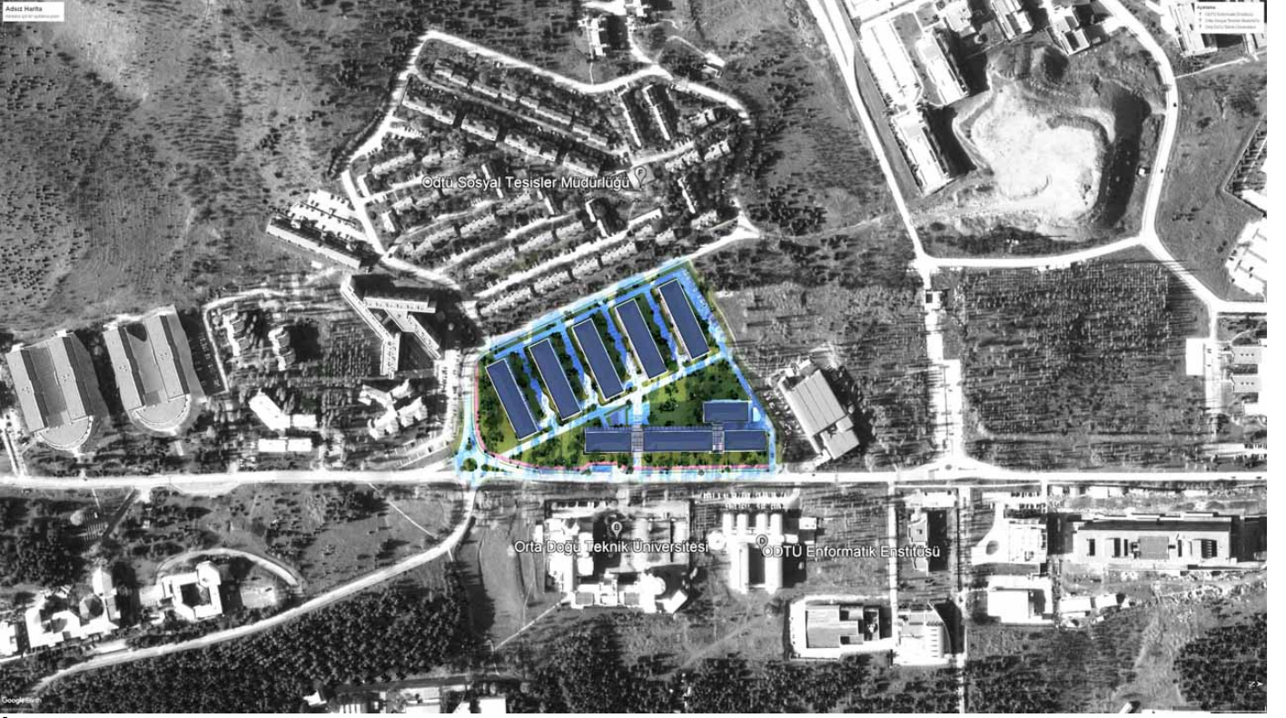
İnşaat sonrası Kavaklık