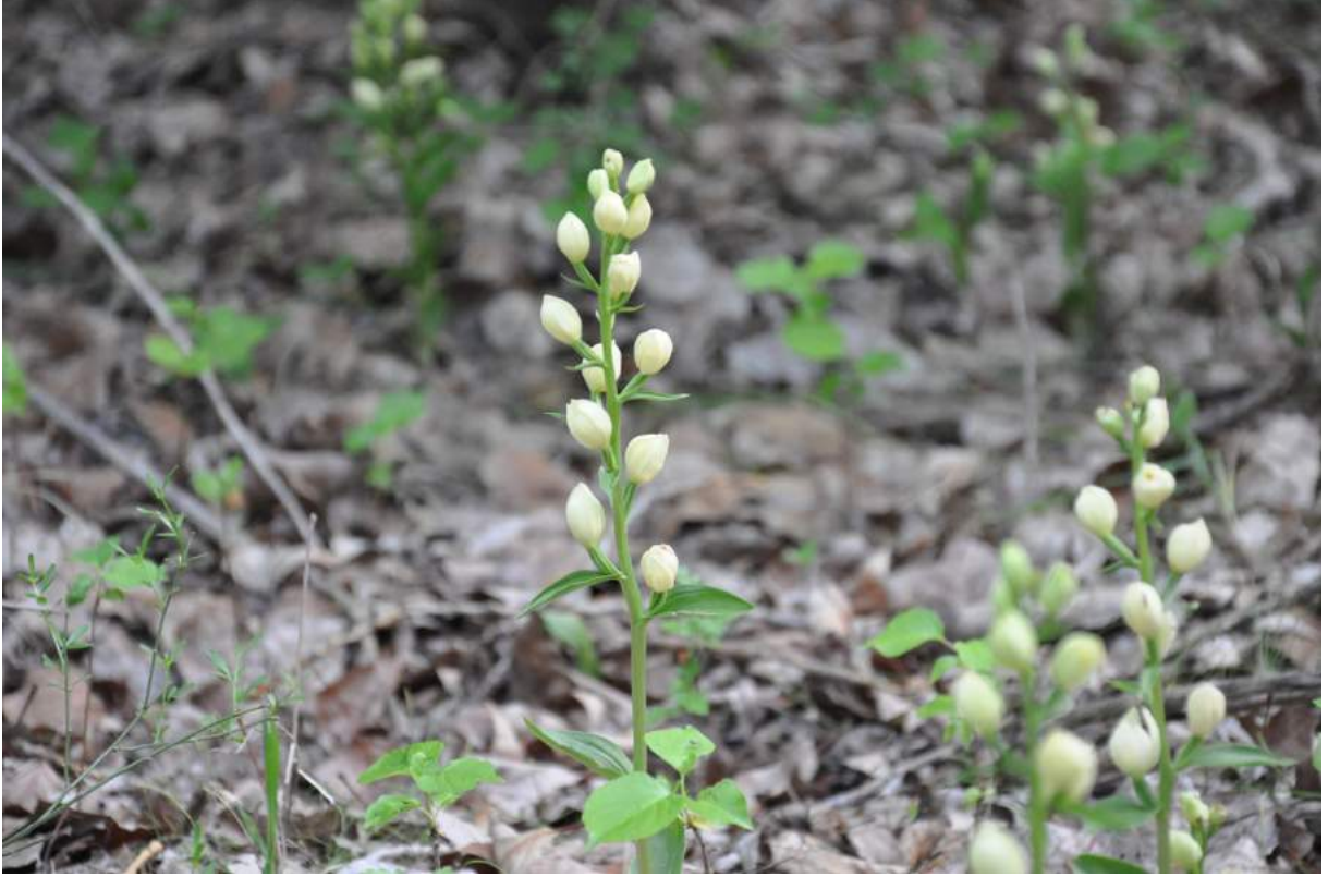
Şekil 3. Cephalanthera damasonium (Kuğu salebi), Kavaklık, 17 Mayıs 2019