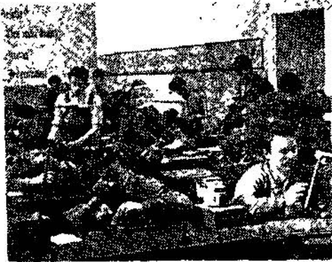
Şekil 1 : Modern bir fabrikada ameli yetiştirme

Endüstri memleketleri ile şark memleketleri arasında fabrika ve fabrikasyon kelimelerinin mânaları aynı şekilde anlaşılmaz. Garpli için fabrika denildiği zaman, Mühendis, kalifiye teknisyen ve işçisi, teknik, kalkülasyon ve ticari büroları olan, seri şekilde rakiplerine karşı, kalite ve maddeleri tespit edilmiş zamanlar içinde imal eden ve daima inkişafı düşünülen bir yer anlaşılır. Garp fabrikaları prensip itibarile kendi işçi ve teknisyenini dâima kendisi yetiştirir. Her fabrika aynı zamanda bir sanat okulu ve araştırma yeri gibi kabul etmek icab eder. İşçi burada çırak olarak hususî, nazarı ve ameli olarak bilhassa kendi fabrikası ile ilgili sahalarda senelerce yetiştirilir, imalât için işçi sıfatını aldığı zaman işinin tam ehli bir işçi olarak tezgâh başında görebiliriz. Bir fabrikada yetiştirilen bir işçinin fabrikaya olan bağlılığının da fazla olması bakımından garbin kabul ettiği fabrika ve fabrikasyon sisteminin bugünkü endüstrinin inkişafı için bir temel teşkil ettiğini kabul etmek icab eder. No. 1 ve 2 Fotoğraflar bir fabrikada çıraklara verilen nazarı dersleri ve ameli olarak nasıl yetiştirildiklerini göstermektedir: