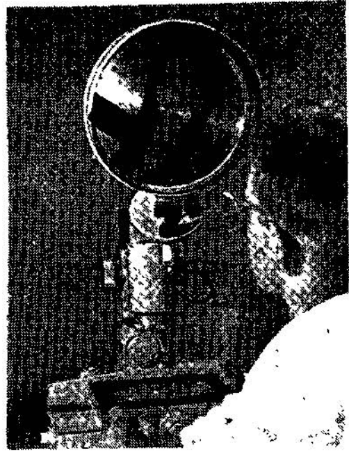
Şekil 4 Parçanın agrandismanla kontrolü.

Bugün bir memleketin kültürü hiç şüphesiz onun teknik alandaki ileri durumu ile ölçülmektedir. Endüstrimizin kalkınması umumi hayatın topyekûn kalkınması demek olduğuna göre, her işimizde tekniğe vereceğimiz önemle mütenasip müsbet gelişmeler meydana gelebilecek, önem verilmediği müddetçe de sarf edilen para, zaman ve enerji boşa gidecek, bir asır evvelki ihmaller nasıl bugün kolay telafi edilemiyorsa, bugünkü fırsatlar iyi kullanılmadığı takdirde gelecekte islâhı imkânsız güçlüklerle karşılaşılacağını kabul etmek ve topyekûn daima ve her alanda semereli iş başarmağa mecbur olduğumuza inanmamız zarruri ve elzemdir.