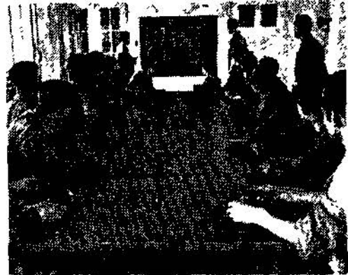
Şekil 2 : Modern bir fabrikada nazari yetiştirme

Garpli nazarında, fabrika demek, teknik, inkişaf, yenilik, kalite ve kalifiye işçi demek olduğundan her fabrika kendi imalâtı için dünyadaki bütün rakip fabrikaların imalâtlarıyla yakından ilgi gösterir. Hedef daima daha iyisi, daha ucuzu için imalât, teknik teçhizatını daha iyi organize etmektir. Holânda da her 25 işçiye bir yüksek tahsil görmüş mühendis ve mütehasşis isabet eder. Her iş ve herşey mutlaka teknik esaslara dayanarak ikmal edilir. Kalifiye işçi, teknisyen ve mütehasşislerin, hayatlarını muayyen branş ve işlerde geçirmeleri ve böylelikle her işin daha kolay inkişaf edebilmesi her fabrikada sağlanmıştır.