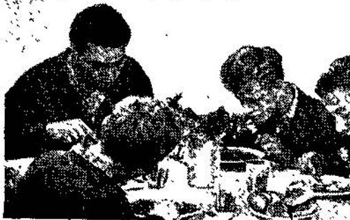
Şekil 5 : Fabrikada yemek

Fabrikalarımızda tam mânâsile standartlar üzerine ve mailiyeti tam olarak hesaplanmış kalite prodüksiyon yapanlar ve bu gaye için bol teknisyen ve mühendis istihdam edenler hemen yok gibidir. Piyasadaki mamullerin bozukluğunu, hoş görmemiz istenilen arzu edilen iskartalar, ne yapalım yerli mal bu kadar ölür zihniyeti, işte fabrikalarımızda garp zihniyetile çalışılmadığına, ucuz ve bozuk imalâtın hedef tutulduğuna, kalifiye işçi ve teknisyenlere" önem verilmediğine, bilhassa mühendis istihdamı onlar için adeta, onların gelişi güzel imalâtı için bir engel sayıldığına birer delil teşkil etmektedirler.