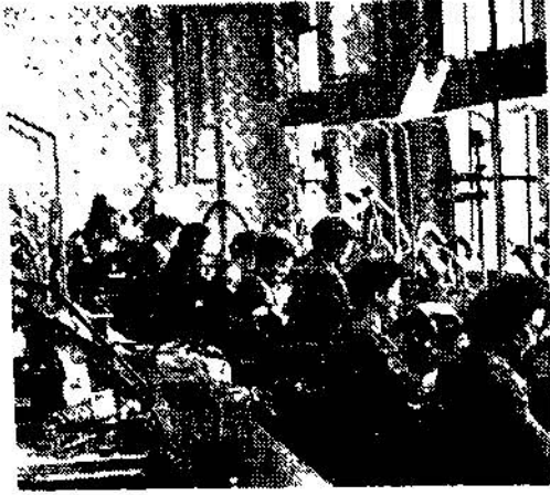
Şekil 3 Modern bir fabrikada konstrüksiyon bürosu.

prodüksyonu tanzim edilmiş, muayyen bir zaman için muayyen bir işin bitirilmesini sürekli olarak sağlamış fabrikalar az olduğu gibi hemen hemen hiç bir fabrikada endüstri memleketlerinde olduğu gibi kendi işçisini yetiştirmek için bir organizasyona malik değildir. Fabrikalar işçilerin ekseriya harçten temin ederler ve uzun zaman bir fabrikada muayyen bir iş üzerinde çalışan işçi ve teknisyen yüzde itibarile çok cüzidir.