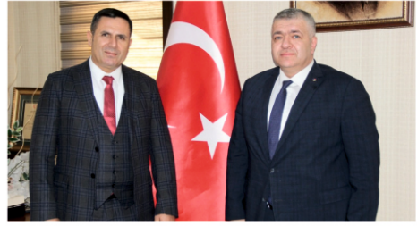
Kadınlar Günü'nü kutluyor yaşamları boyunca mutluluk ve başarılar diliyoruz.”

ulaşabileceğimizi hiçbir zaman unutmamalıyız. Ülkemizin beşeri sermayesinin yarısını oluşturan kadınlarımızın fırsat tanıdığı takdirde tıttız ve özgün bakış açılarıyla sosyal, kültürel ve ekonomik hayatta çok başarılı işlere imza atacak potansiyelle ve becerileri sahip olduklarına yürekten inanıyoruz. Bu duygu ve düşüncelerle başta aziz şehitlerimizimiz bu vatana emaneti değerli anneleri ve eşleri olmak üzere tüm kadınlarımızın 8 Mart Dünya