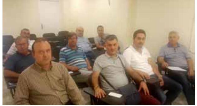
Aydın İl Temsilciliği