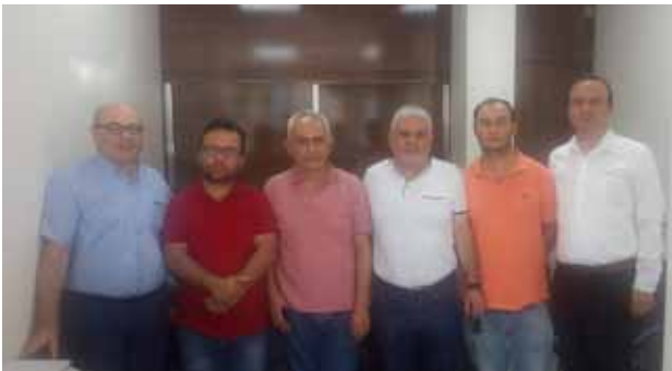
Alaşehir İlçe Temsilciliği