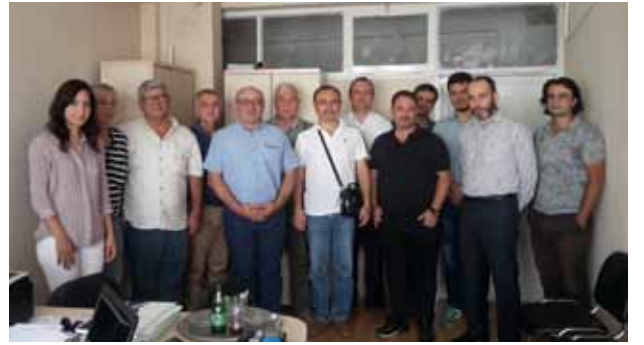
Salihli İlçe Temsilciliği