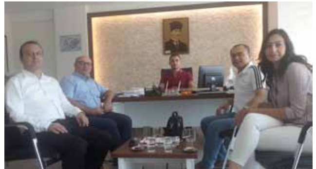
GDZ Elektrik Salihli İlçe Yöneticiliği