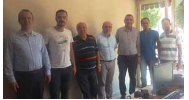
Akhisar İlçe Temsilciliği