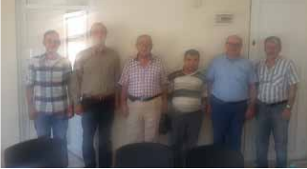
Nazilli İlçe Temsilciliği

Şube Yönetim Kurulu tarafından değerlendirilerek Oda Yönetim Kurulu'na sunulacak.