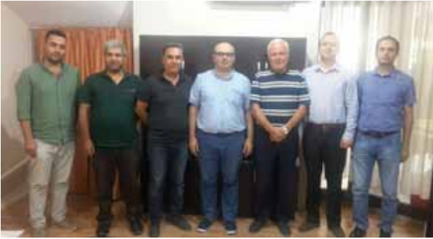
Ödemiş İlçe Temsilciliği