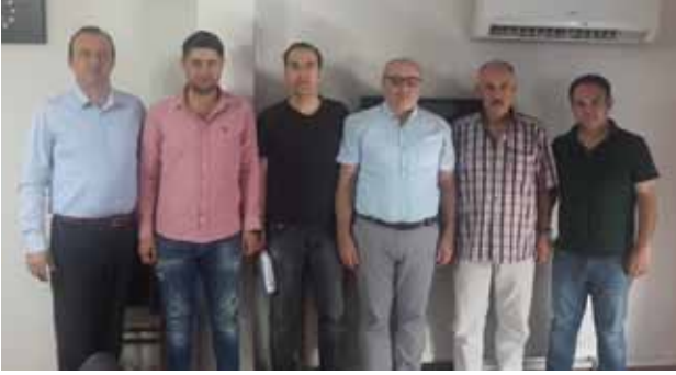
Soma İlçe Temsilciliği