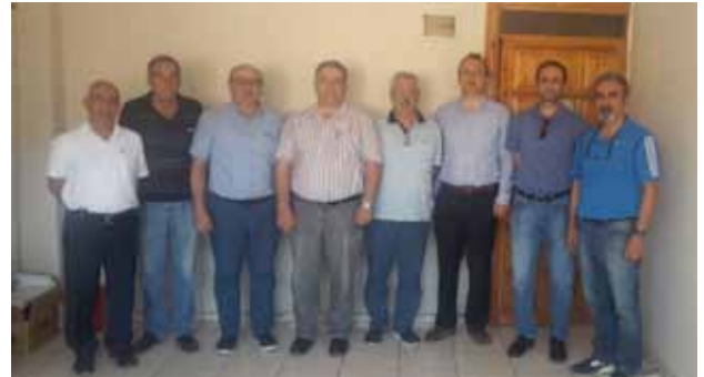
Tire İlçe Temsilciliği