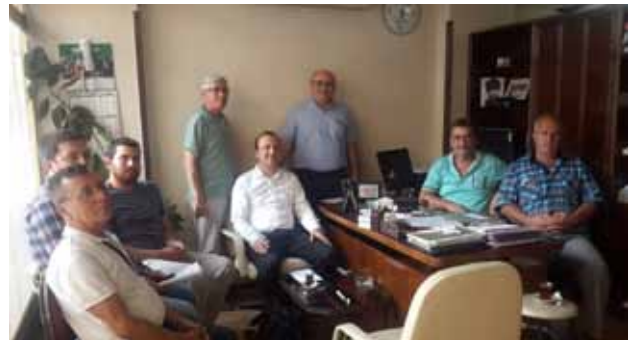
Turgutlu İlçe Temsilciliği