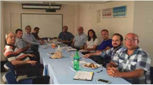
Manisa İl Temsilciliği