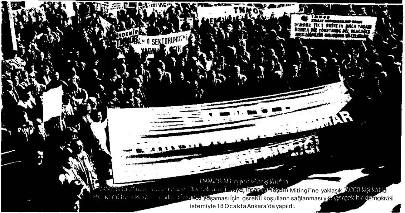
TMMOB Mitingine Çoğuş Katılımı TMMOB Enerji ve Maden Platformu "Demokratik Türkiye, İnsanca Yaşam Mitingi"ne yaklaşık 7.000 kişi katıldı. Miting için hazırlanan ve "Yatılı" maddesiyle "İnsanca Yaşam" için gerekli koşulların sağlanması ve gerçek bir demokrasi istemiyle 18 Ocakta Ankara'da yapıldı.