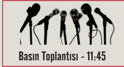
Basın Toplantısı - 11:45

Enerji, Nükleer Enerji, Dünya ve Türkiye