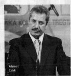
EMO'NUN AÇIKLAMASI: Vakıfbank'la Türk Telekom, Çalık'a çalıştı