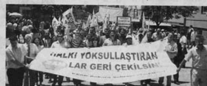
KESK üyesi kamu çalışanları, elektrik zammını ve diğer zamları protesto için AKP Ankara 8 Başkansı'na yürüdü. KESK Başkanı Kemal Hakkı Tombul, çağrılanın açtığı sorunlar arasında ücretlerin muhtemelen olduğu belirterek zamları eleştirdi.

Enerji Piyasası Düzenleme Kurulu (EPDK), Türkiye Elektrik Dağıtım Anonim Şirketi'ne (TEDAŞ) bağlı 20 elektrik dağıtım şirketinin zam talebini onayladı. Buna göre, Yılımdan itibaren 20'ye çıkan elektrik fiyatları 1 Temmuz'dan itibaren konutlarda yüzde 21, sanayiye yüzde 22 oranında zam yapılacaktır. Kamu Enerji Satışları Kurumu (KESK) üyesi vatandaşlar, elektrik zammını ve diğer amillerden dolayı elektrik fiyatlarının artmasını protesto için AKP Ankara 8 Başkansı'na yürüdü. Elektrik Mühendisleri Odası (EMO) Genel Başkanı Musa Çeçen, "Otomatik zam sistemiyle 4 kişilik ailenin aylık elektrik faturasını 80-100 YTL'ye çıkaracak" diye uyardı.