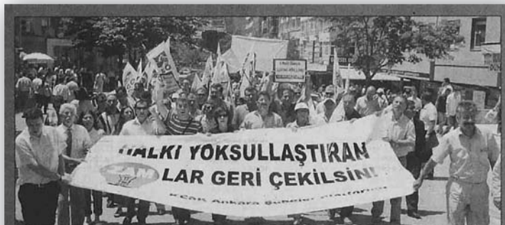
KESK üyesi bir grup, elektrik zammını protesto etmek amacıyla Sakarya Caddesi'nde eylem yaptı. Elektrik Mühendisleri Odası Genel Başkanı Musa Çeçen de, "Otomatik zam sistemiyle 4 kişilik ailenin aylık elektrik faturasını 80-100 YTL'ye çıkaracak" dedi.