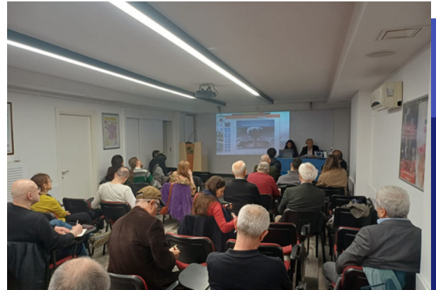
Çernobil'in 40. Yılında Nükleer Tehdidin Gölgesinde Türkiye Paneli