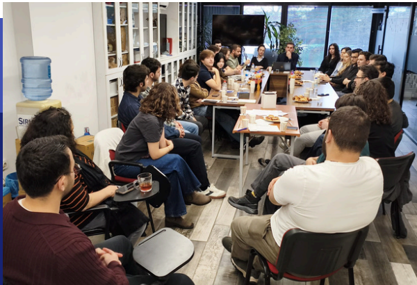
EMO-Genç İstanbul Temsilcilerini Seçti

EMO İstanbul Şubesi üyesi öğrencilerden oluşan EMO-Genç İstanbul Meclisi, 28 Mart 2026 Cumartesi günü Elektrik Mühendisleri Odası İstanbul Şubesi Eğitim Salonu'nda bir araya gelerek Şube EMO-Genç Komisyonu'nu temsilcilerini seçti. Devamı >>